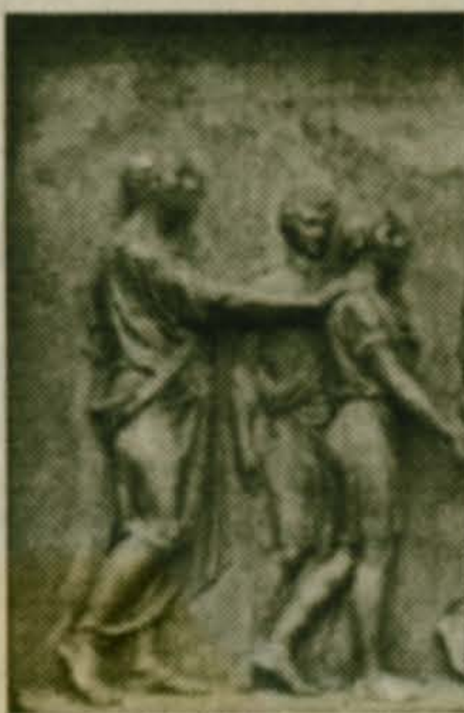
Москва - 850!