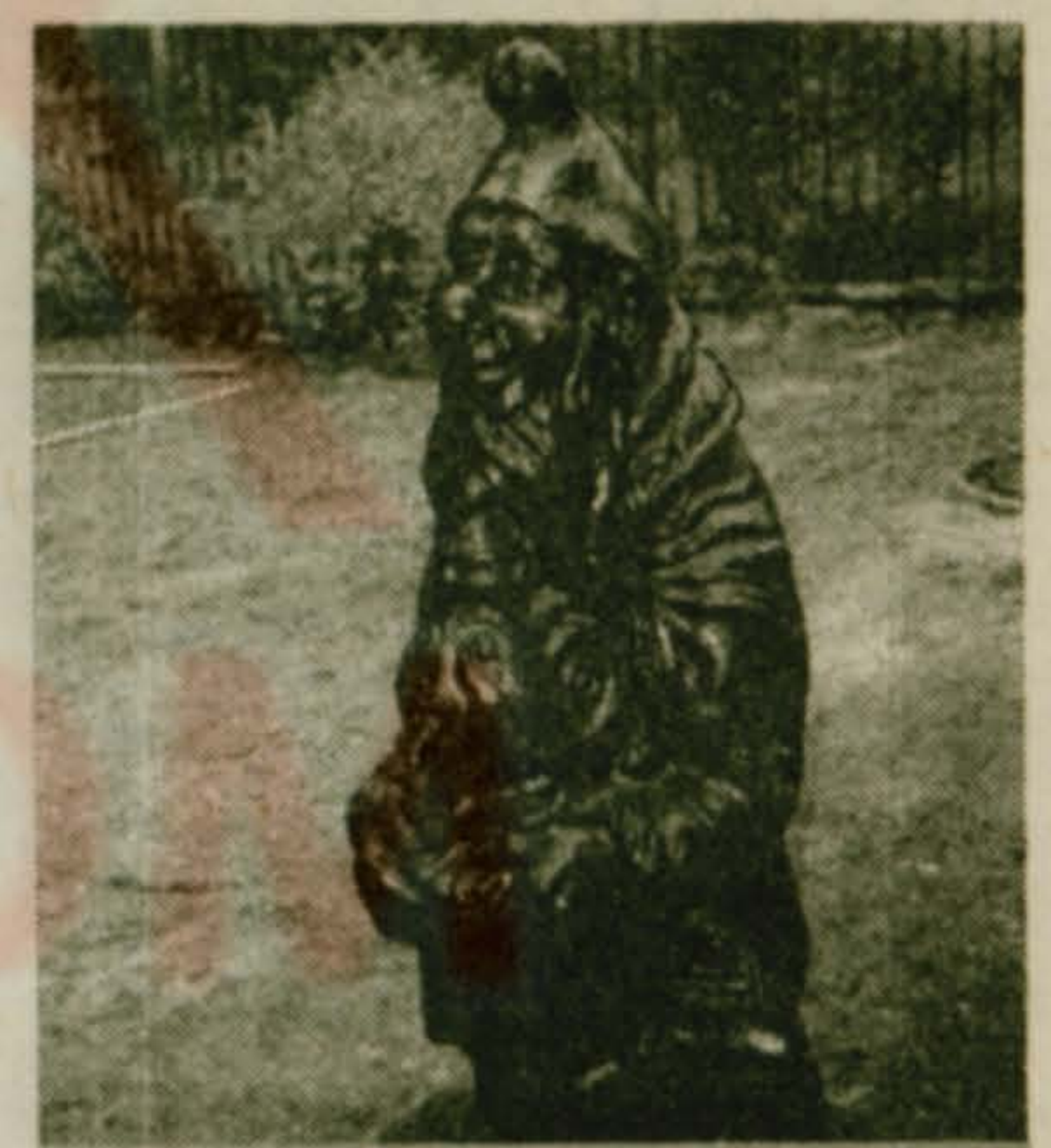
Уже третья сказочная скульптура работы В.И. Першина появилась в нашем поселке.

Констатированы три смерти, происшедшие до приезда "Скорой". В одном случае это-женщина 97 лет. В двух других - мужчины 50 и 52 лет.