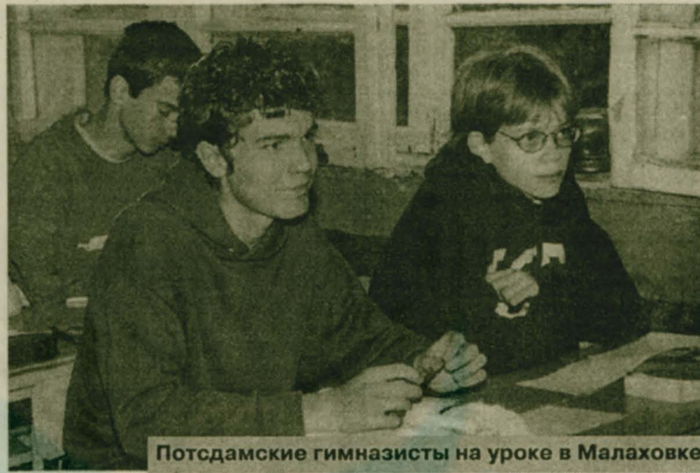
Потсдамские гимназисты на уроке в Малаховке