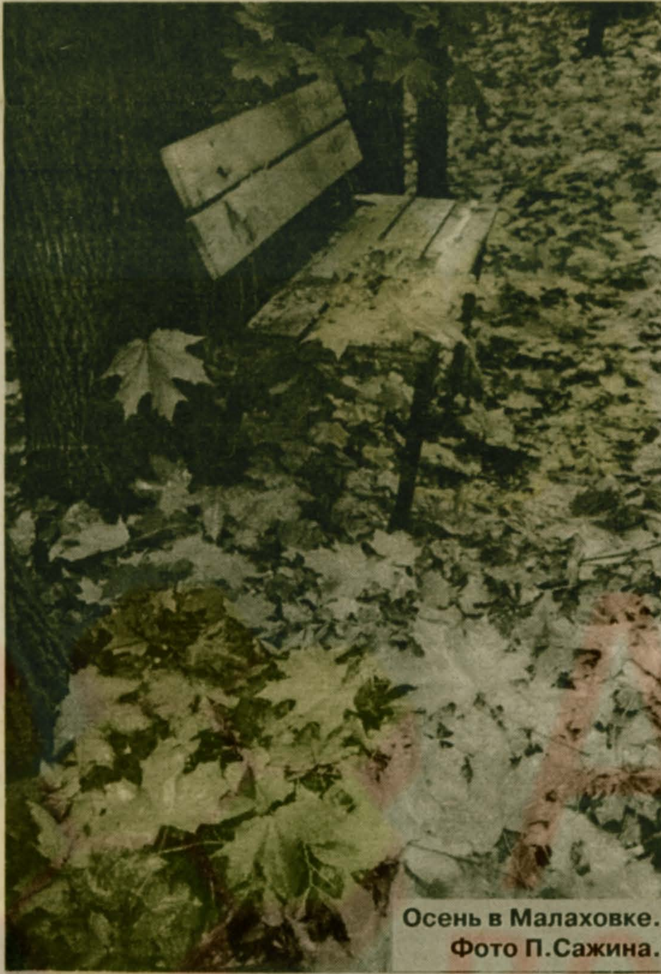
Осень в Малаховке.

Дорогого вам всем здоровья, благополучия и долгих лет!