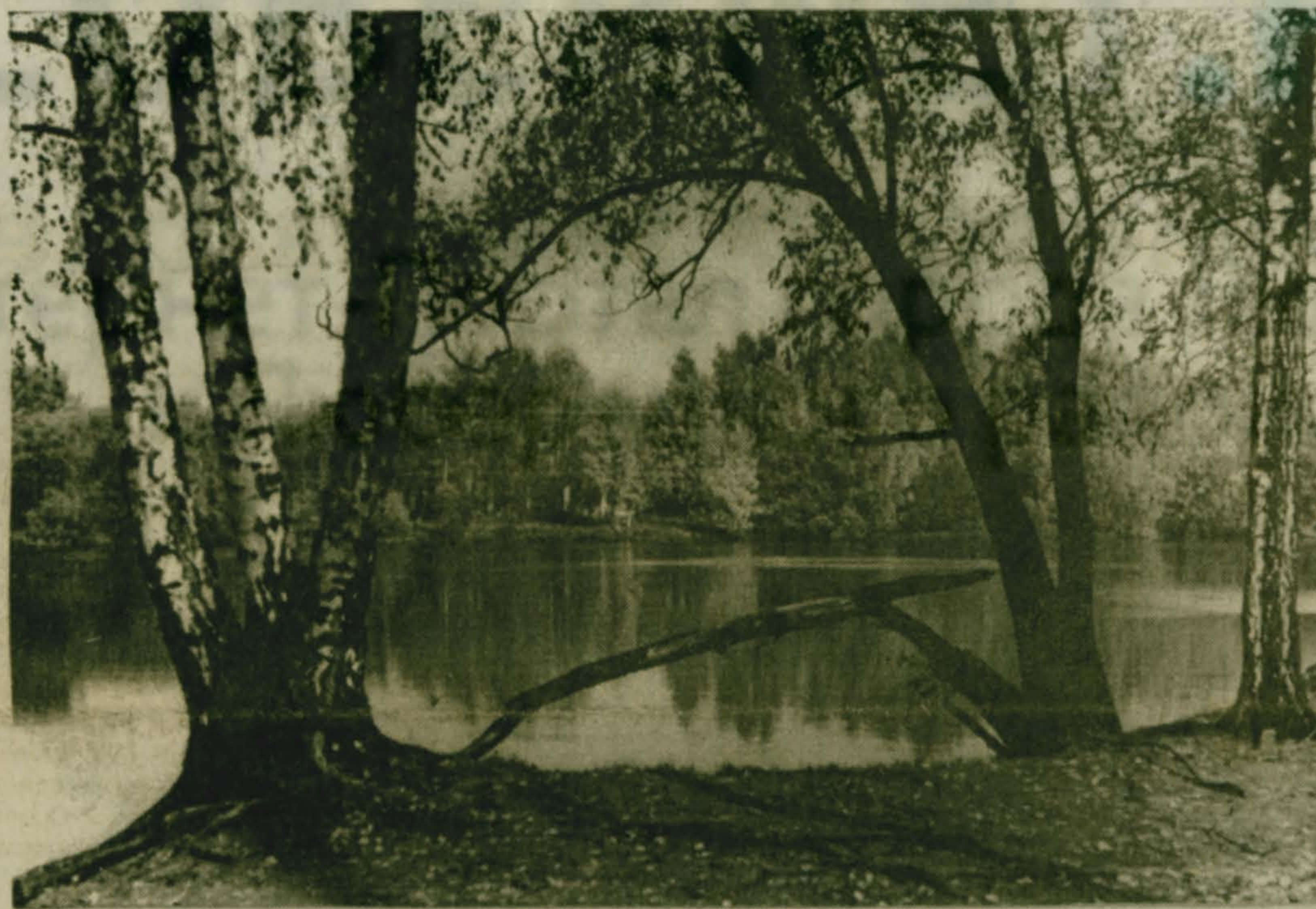
Озеро надежды... Сумеет ли сохранить эту красоту не только на фотографиях?..

почти во всем жилом фонде Малаховки обеспечивается Люберецкой теплосетью. Исключение составляют дома №№ 1-26 на Быковском шоссе и некоторые другие в разных частях поселка. Жители будут оплачивать отопление непосредственно "Теплосети" за каждый прошедший месяц, то есть до 20 ноября за октябрь и так далее. Оплата принимается во всех почтовых отделениях.