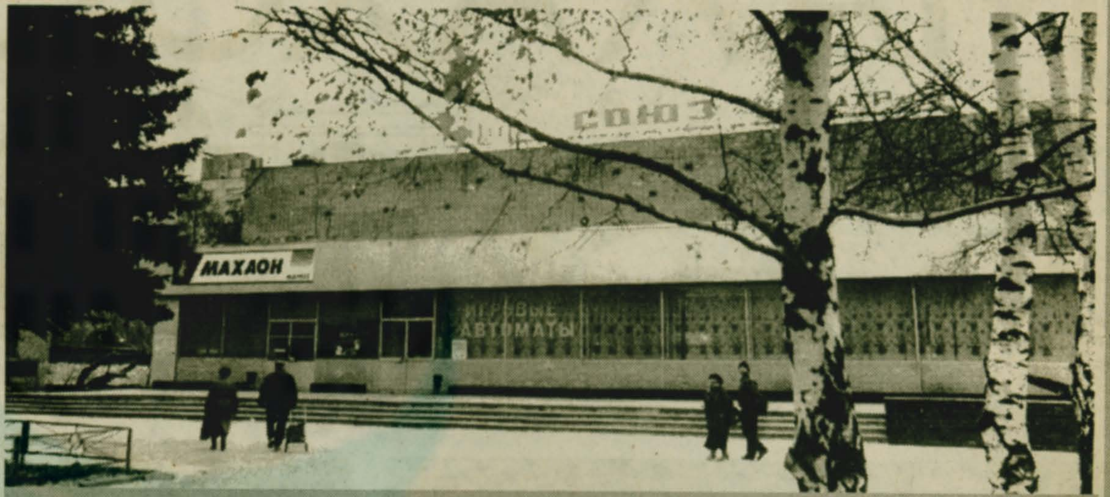
Сегодня "Союз" отмечает свое 25-летие и прошлогодние поздравления В.Меньшова сегодня особенно актуальны.

Завтра - очередная годовщина Октябрьской революции. Или -большевистскому перевороту. Как ни назови это событие, а историю оно действительно перевернуло. Не "десять дней, которые потрясли мир" /если бы/, а 80 лет, разделившие мир на два лагеря.