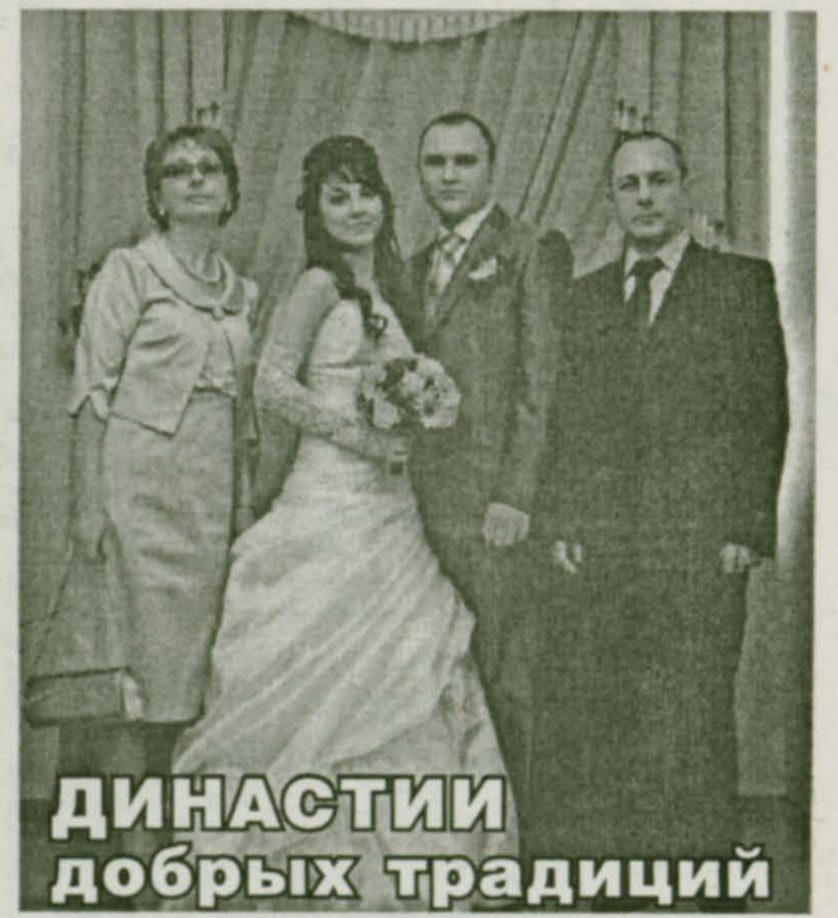
ДИНАСТИИ добрых традиций

Так каковы они – истинные цели создания семьи? Жить вместе в любви и радости. Созидать, творить, растить детей. Все, по крайней мере – многое, делать вместе. Получать удовольствие от каждого прожитого дня. Заботиться друг о друге. И еще многое-многое другое... А христианские каноны еще предписывают идеальному супружеству – верность и благочестие, совершение дел милосердия и попечения о различных нуждах сограждан. Трудно? Еще как! Но без семьи жизнь на земле прекратится. Поэтому так почитаются у нас люди, сумевшие прожить с избранным человеком многие годы. Ради общего блага, ради близких, ради детей. Действительно, когда подлинное тепло у обоих в сердце, то они будут стараться не растерять его, а приумножить. Жертвовать, вот чему мы должны научиться в семейной жизни. Жертвовать своим временем, своими желаниями во имя любимого человека. Очень счастливы те, кто уже обрел вторую половинку, без которой себя не мыслит. А остальное все приложится! Наверное, о таких людях и говорят – истинные браки заключаются на небесах, что Бог соединил – человек разделить не может. Поздравляем всех юбиляров, от деревянной до бриллиантовой свадьбы, желаем добра и согласия, взаимного уважения и поддержки. Мира всем и любви!