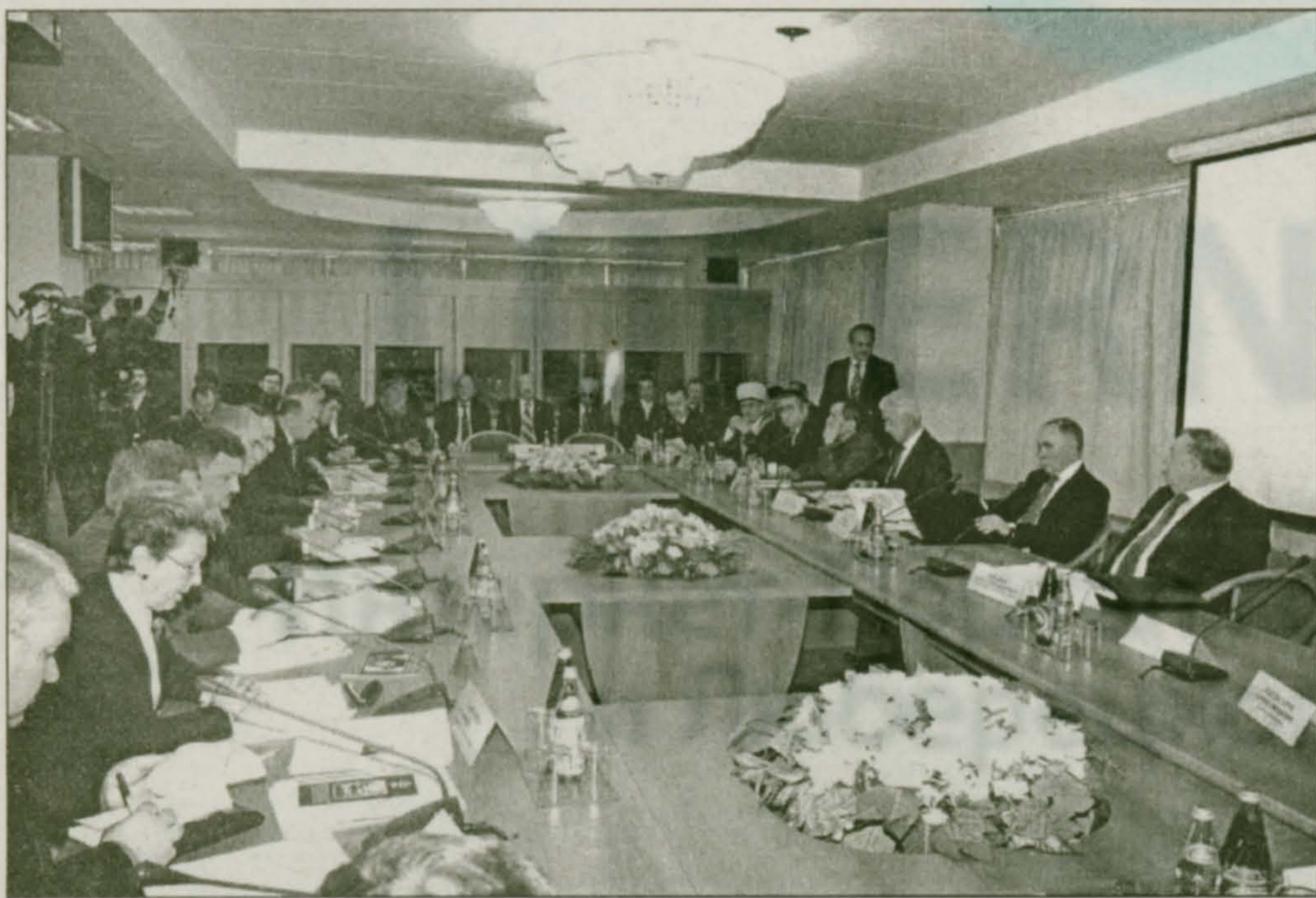
Федерального собрания Российской Федерации Борис Грызлов.

С докладом выступил директор Федеральной службы Российской Федерации по контролю за оборотом наркотиков Виктор Иванов.