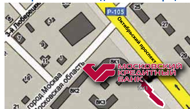
Схема расположения отделения «Люберецкое»

Адрес отделения МОСКОВСКОГО КРЕДИТНОГО БАНКА в г. Люберцы: Октябрьский пр-т, д. 10, корп. 1 Тел.: (498) 720-1402, (498) 720-1403 Справочная служба Банка: 8-800-100-4-888 Сайт www.mkb.ru