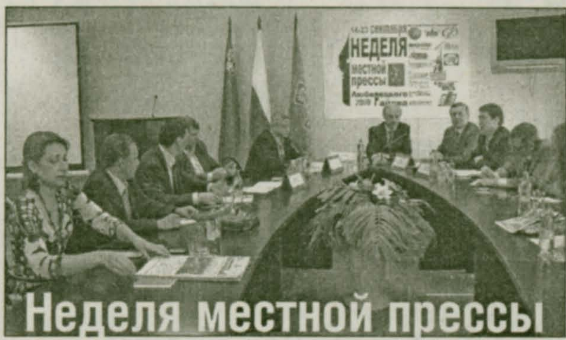
Неделя местной прессы

Проведение 3-й Недели местной прессы Люберецкого района началось со значимого патриотического мероприятия. В понедельник, 14 сентября в Доме ветеранов района состоялся круглый стол на тему: «Роль прессы в освещении подготовки празднования 65-летия Победы». Журналисты не только выслушали и обсудили пожелания ветеранов, но и приняли на себя обязательство осуществлять шефскую помощь для одиноких ветеранов.