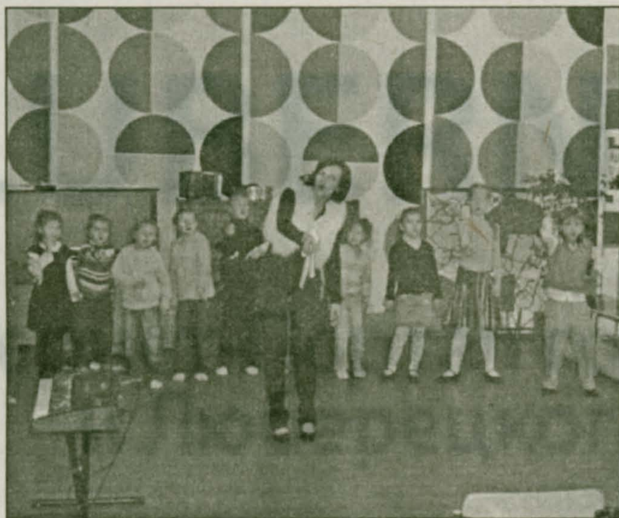
Детский досуговый центр творчества при администрации действует в помещении старой библиотеки

Существует ряд причин способствующих тому, что дети оказываются на улице, предоставленные сами себе. Во-первых, детская незанятость. Значительно сократилось число доступных детских дошкольных учреждений, домов детского творчества, детских санаториев, спортивных учреждений, музыкальных и художественных школ, домов культуры, поселковых клубов и т.д.