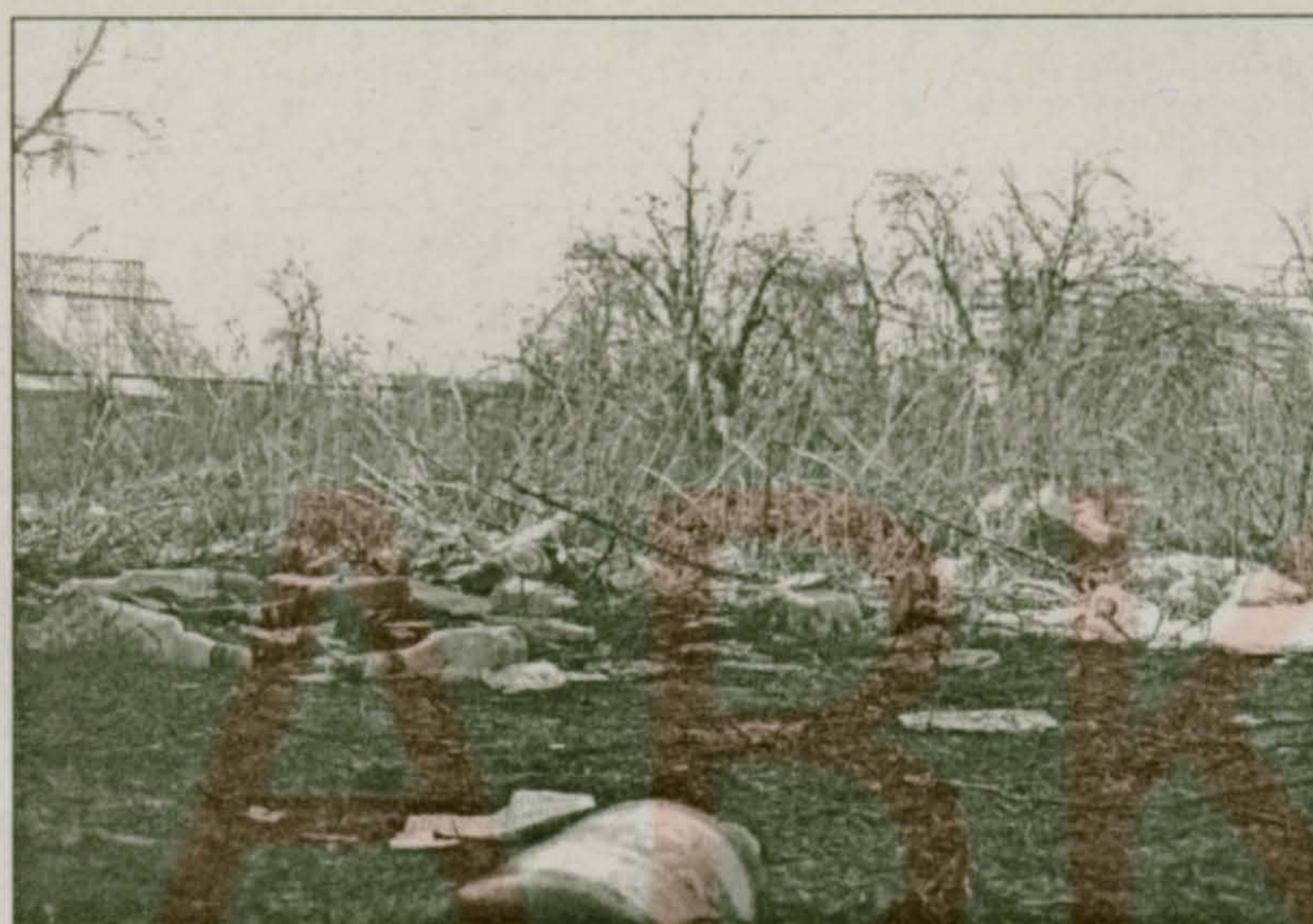
Дурной пример заразителен