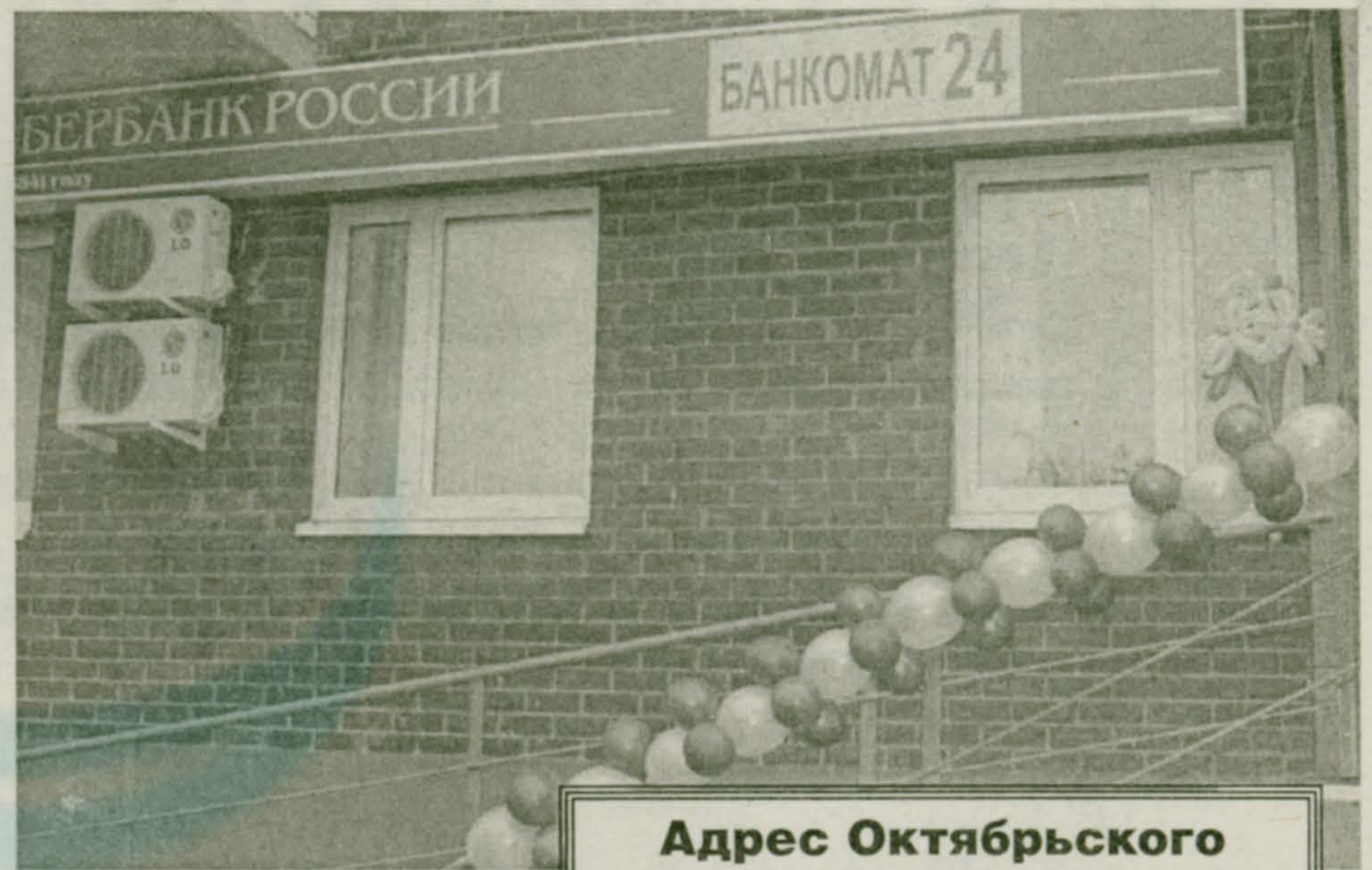
Адрес Октябрьского филиала Сбербанка: ул. Текстильщиков 7а

- Администрация района проводит потрясающие конкурсы среди лучших педагогов, среди школьных творческих коллективов, среди художников, спортсменов. И в этом смысле район дает