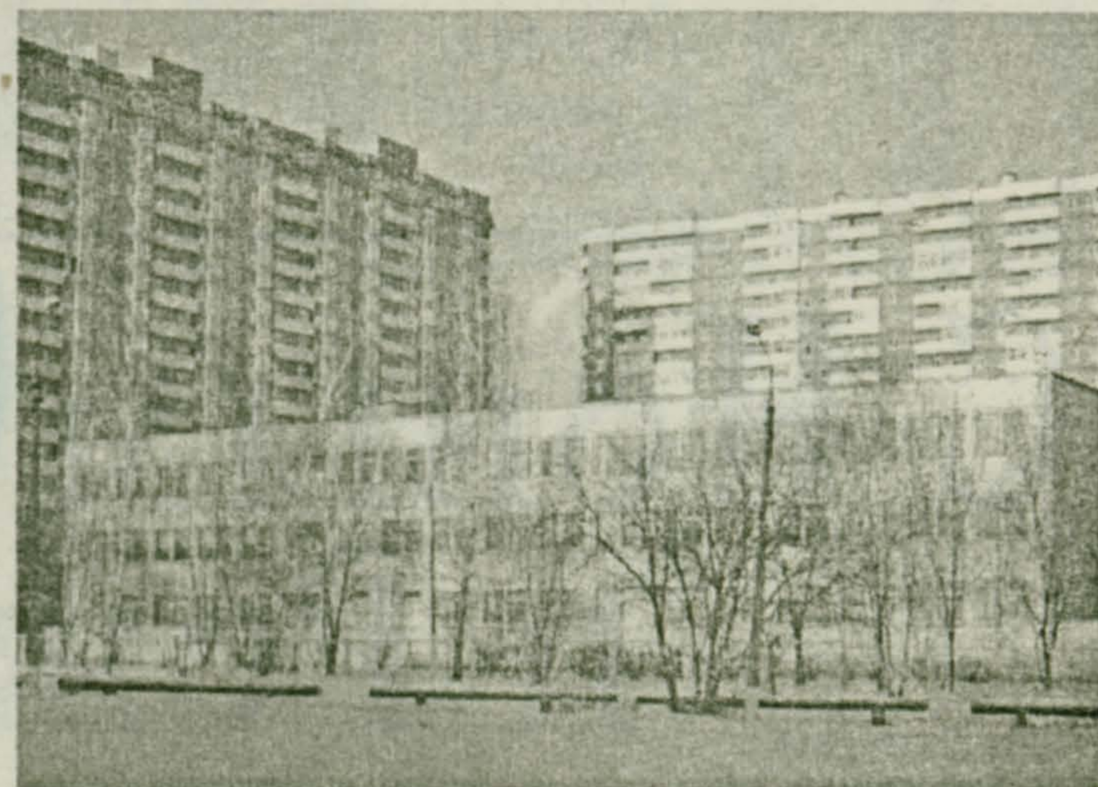
С Рождеством Христовым и Новым годом!

С удовольствием обращаюсь ко всем жителям богоспасаемого поселка Октябрьский, с радостными словами поздравления с праздником светлого Христова Рождества и нового 2010 года. Во дни рождественского праздника мы вспоминаем, как Сын Божий снисшел к людям, чтобы каждый из нас мог воссоединиться с Ним. Но чтобы эта возможность стала реальностью, от нас требуется ответ достойный Божественной любви - наша любовь, любовь деятельная и жертвенная, и пусть строительство нашего храма будет символом нашей любви к Богу, началом пути восхождения для воссоединения с Ним - источником всякой жизни.