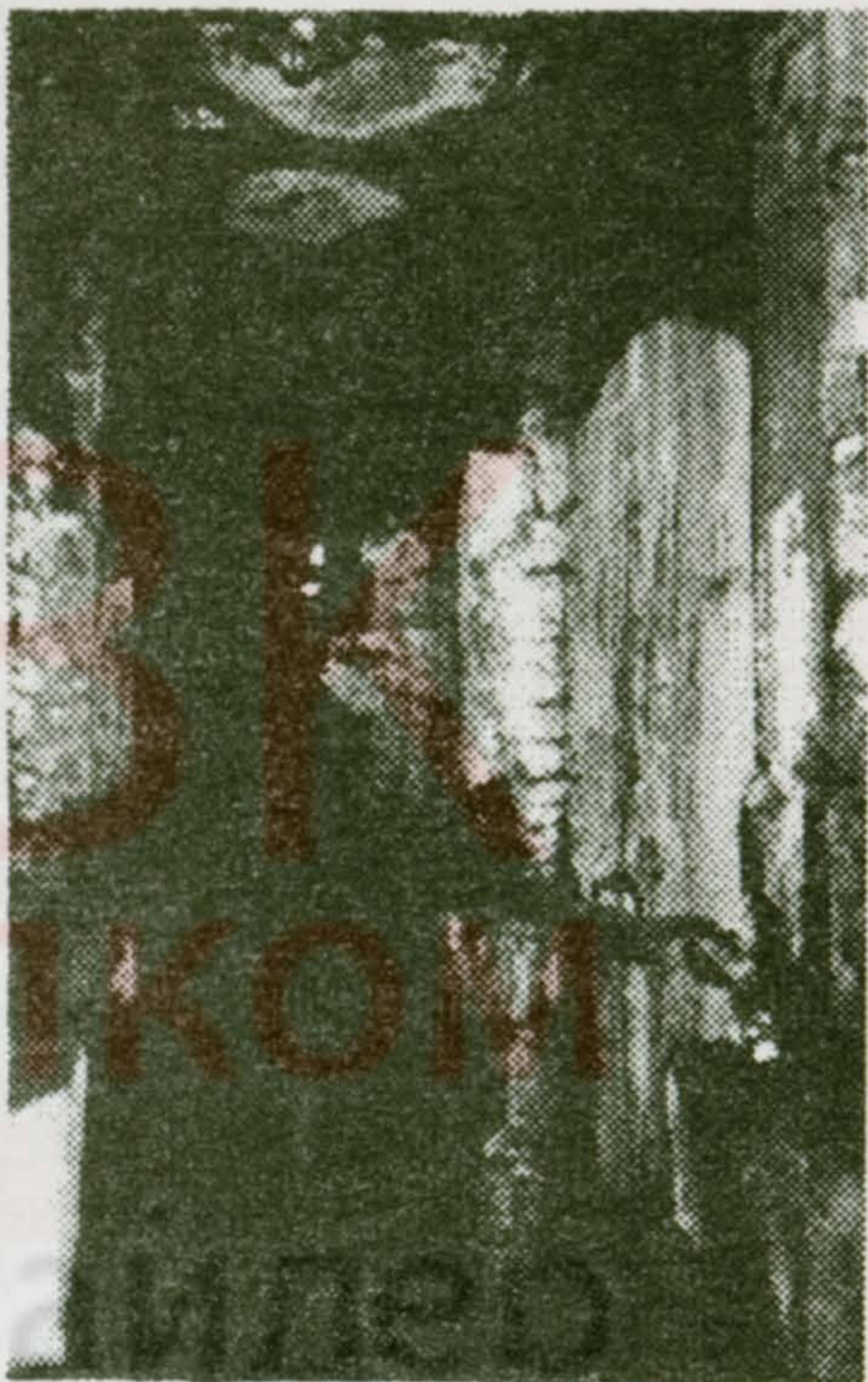
На фото: В любое время можно ждать беды: опоры аэрофильтров еле дышат

Предприятия города примут в реконструкции долевое участие.