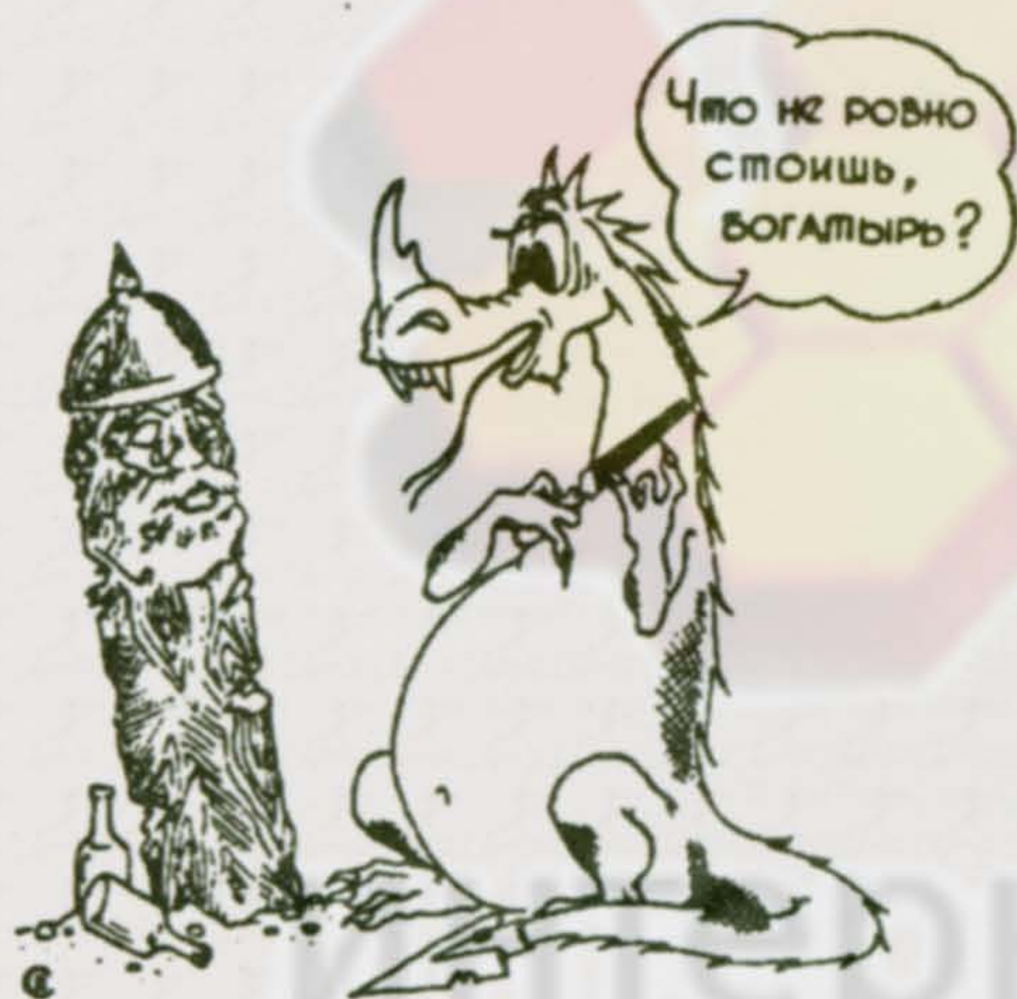
Художественное оформление номера В.НОСОВА