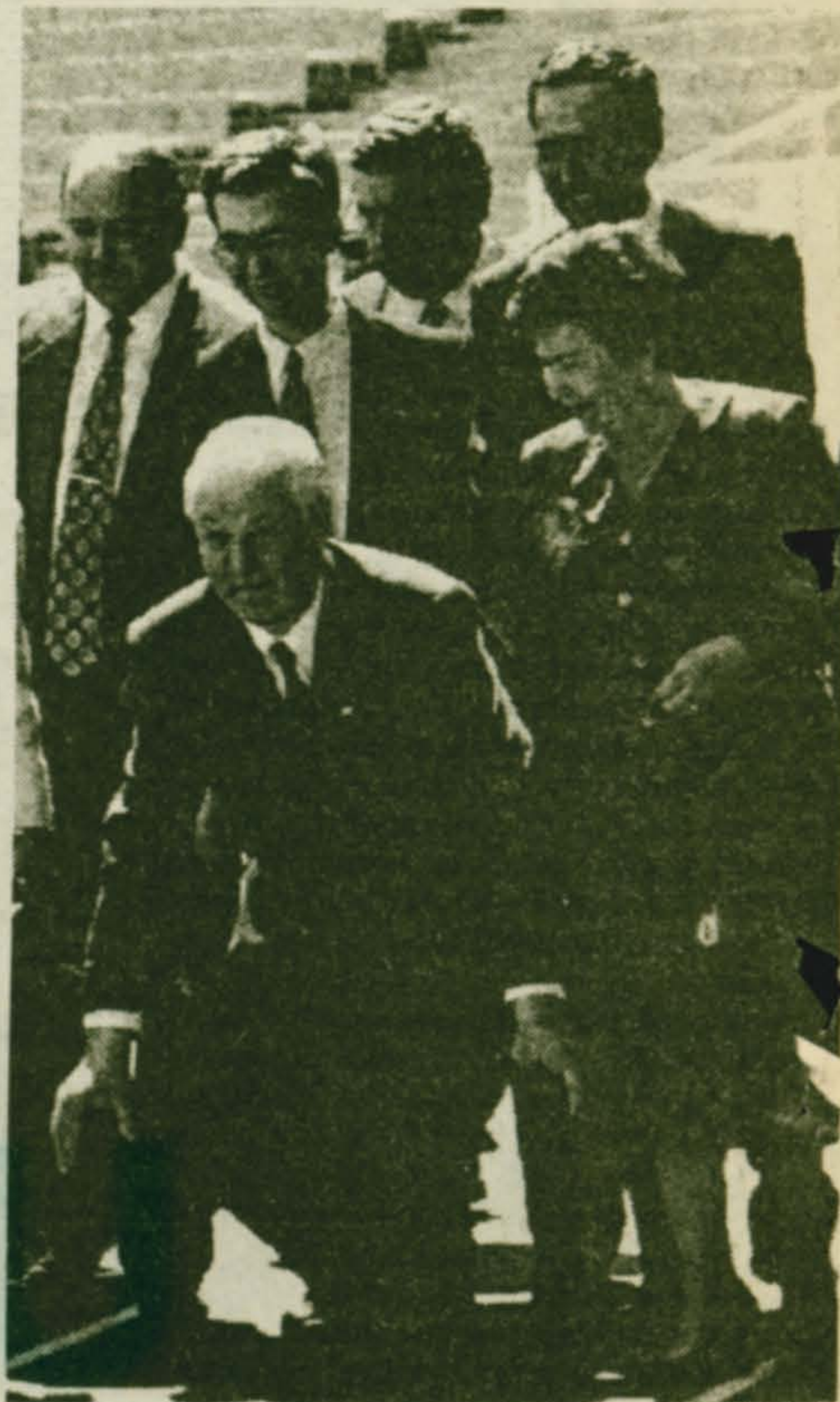
Внимание! На старт!

В кулуарах съезда нами были замечены самые разные люди, приверженцы самых разных взглядов и точек зрения на сегодняшнюю российскую действительность. На съезд приехали — кто на шикарных иномарках, кто на метро или троллейбусом — разные по рангу, профессии и кошельку люди. Привело их в здание бывшего СЭВа, а ныне столичной мэрии одно желание — видеть себя в свободной и сильной России, а страну нашу — без путчей и гражданских войн, процветаю-