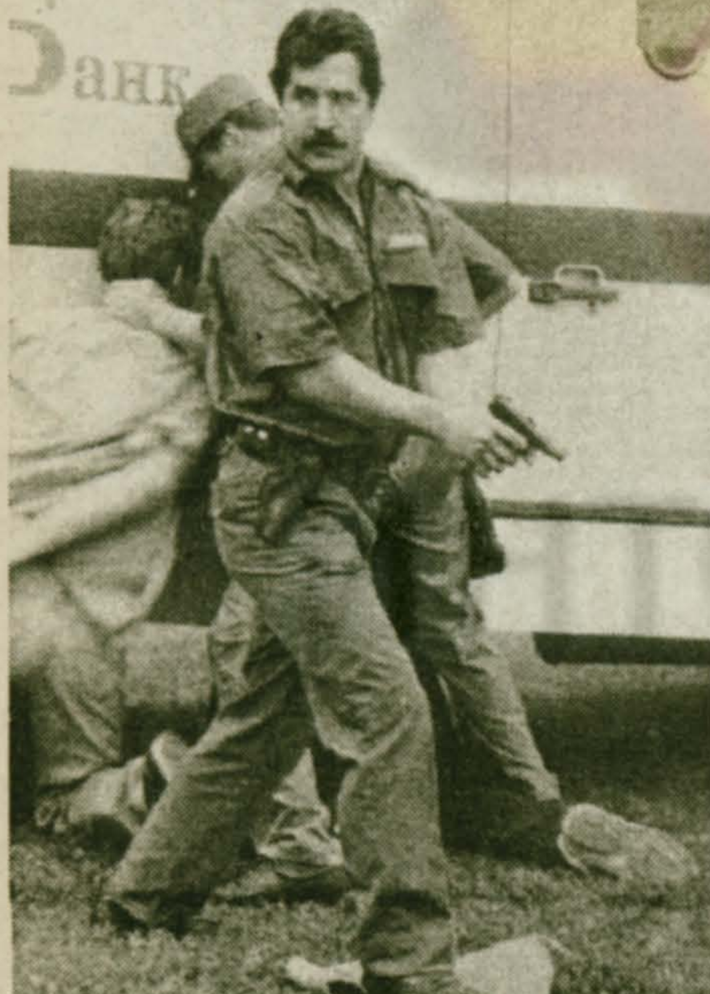
Плохо придется преступникам, ставшим на пути у инкассаторов Межсббанка