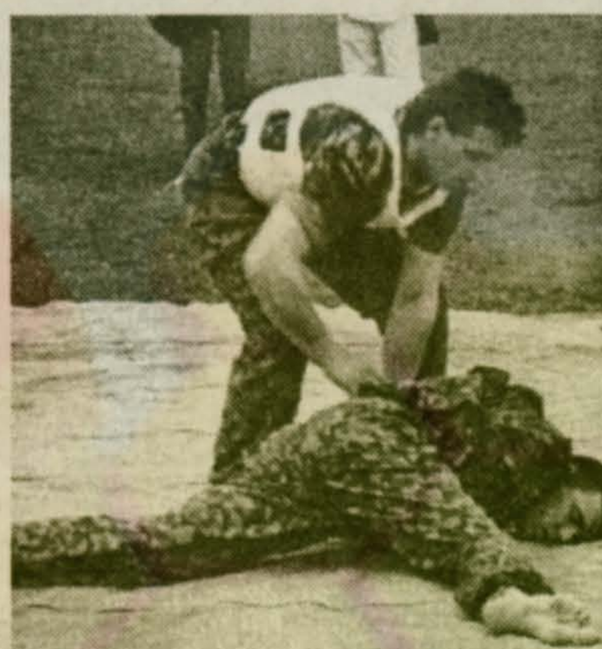
Поймать и обезвредить!

На трибунах стадиона «Орбита» 13 июля собралось множество зрителей. И даже накрапывающий дождик нисколько не омрачил праздника, а даже наоборот — явился благодатью после изнуряющей недельной жары. Отведав «хлеба» в буфете, народ захотел зрелищ. И получил их после нескольких затянутой торжественной части, где выступали с речами гости «Антикри-