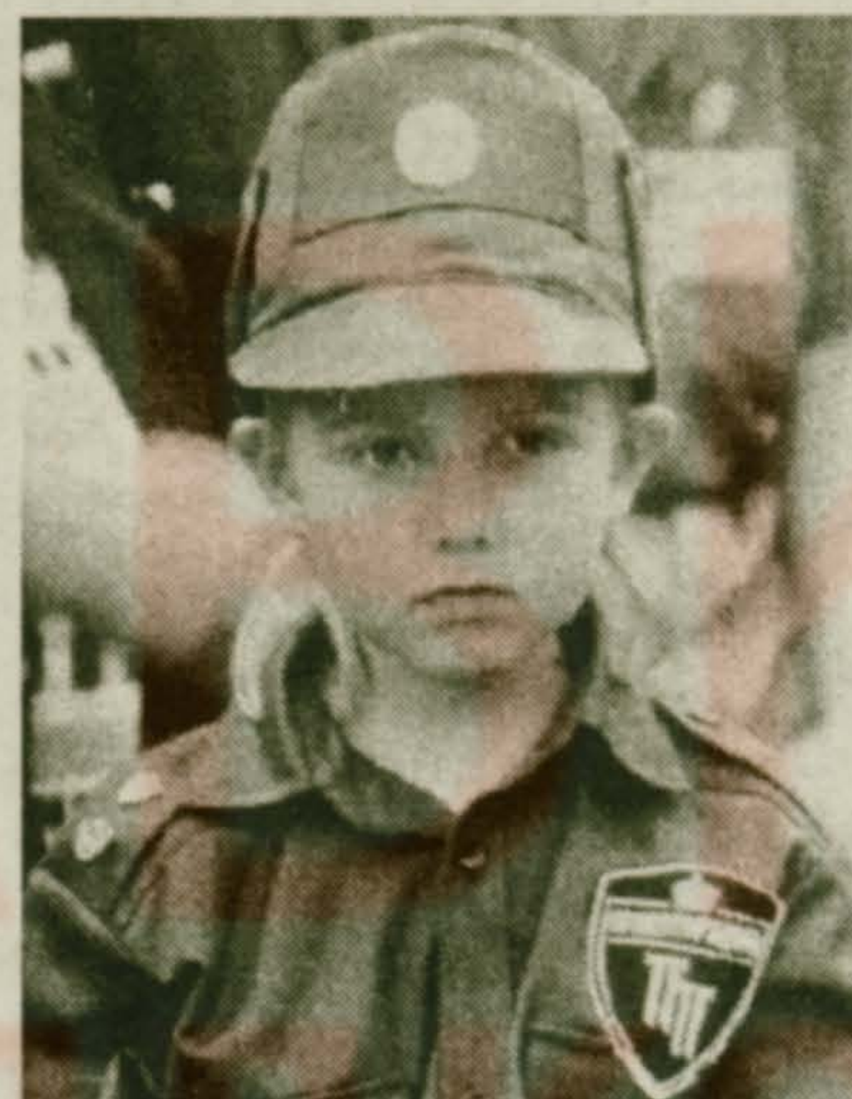
Серезжа и Вовка хотят быть ракетчиками. А я, когда вырасту, стану работать в службе безопасности, как папа

Сотни глаз были прикованы к площадке, где также показывали свое умение и мастерство бойцы ОМОНа, члены ассоциации тхэквондо, знаменитые «краповые береты» из Софрино. Восторг на трибунах вызвало появление конни-