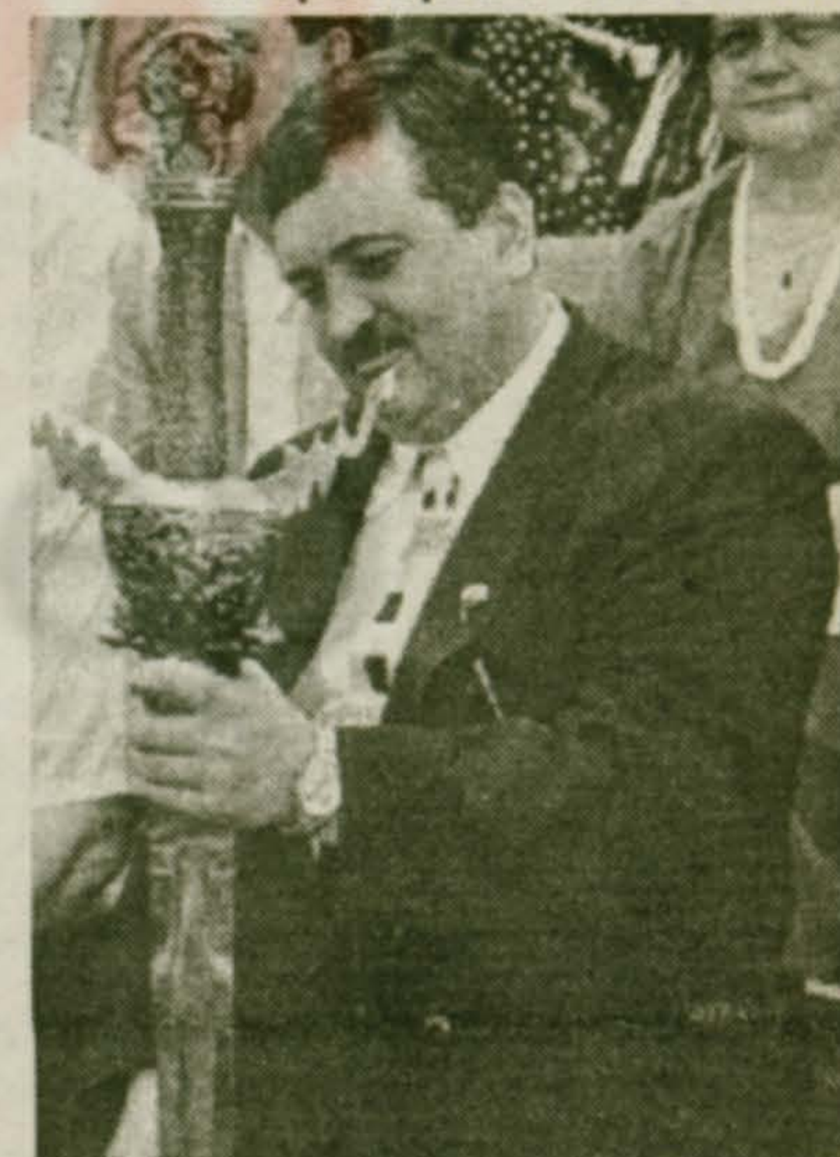
Так вот он какой — меч-кладенец!