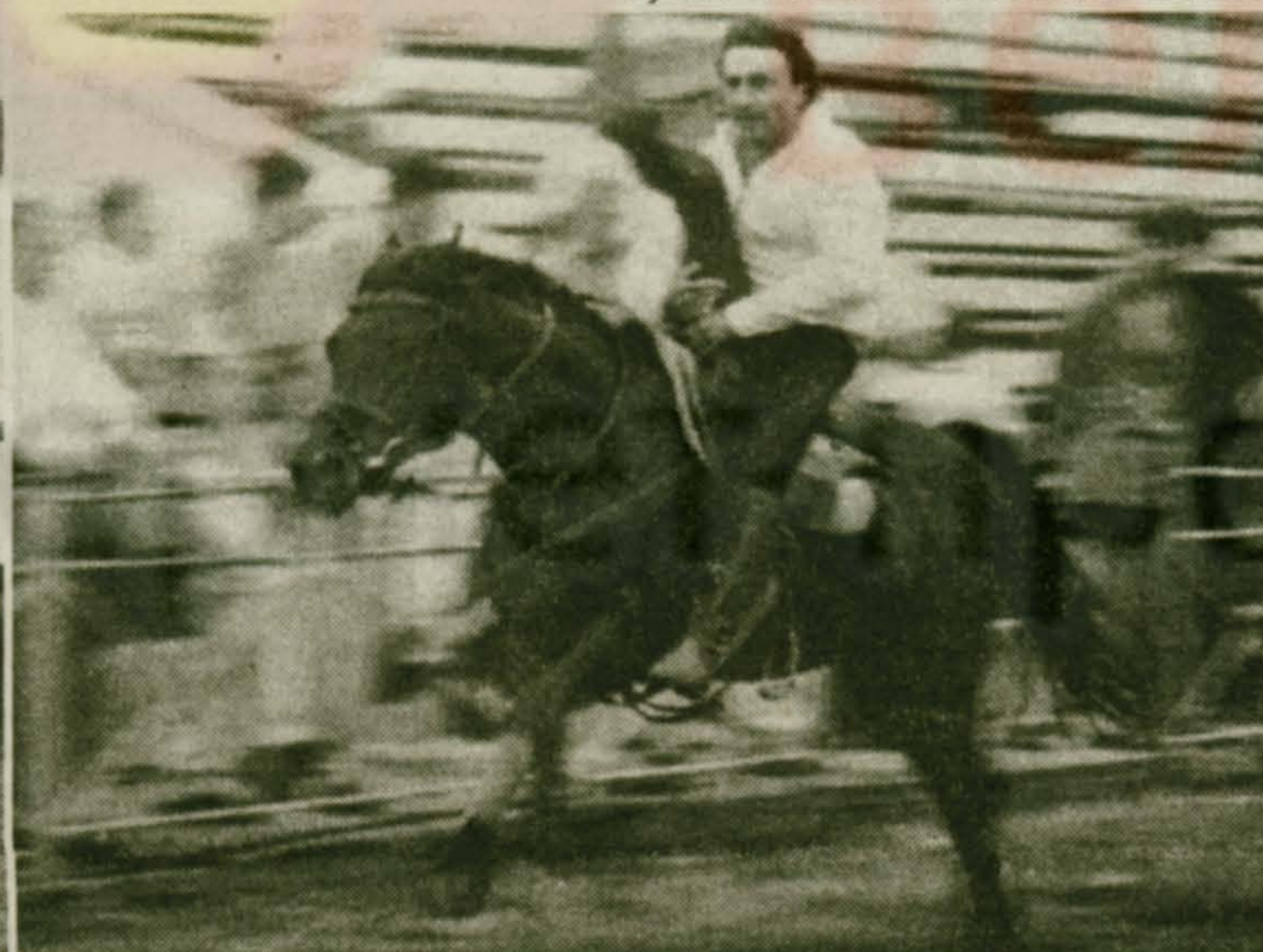
«Неси меня, мой верный конь!»