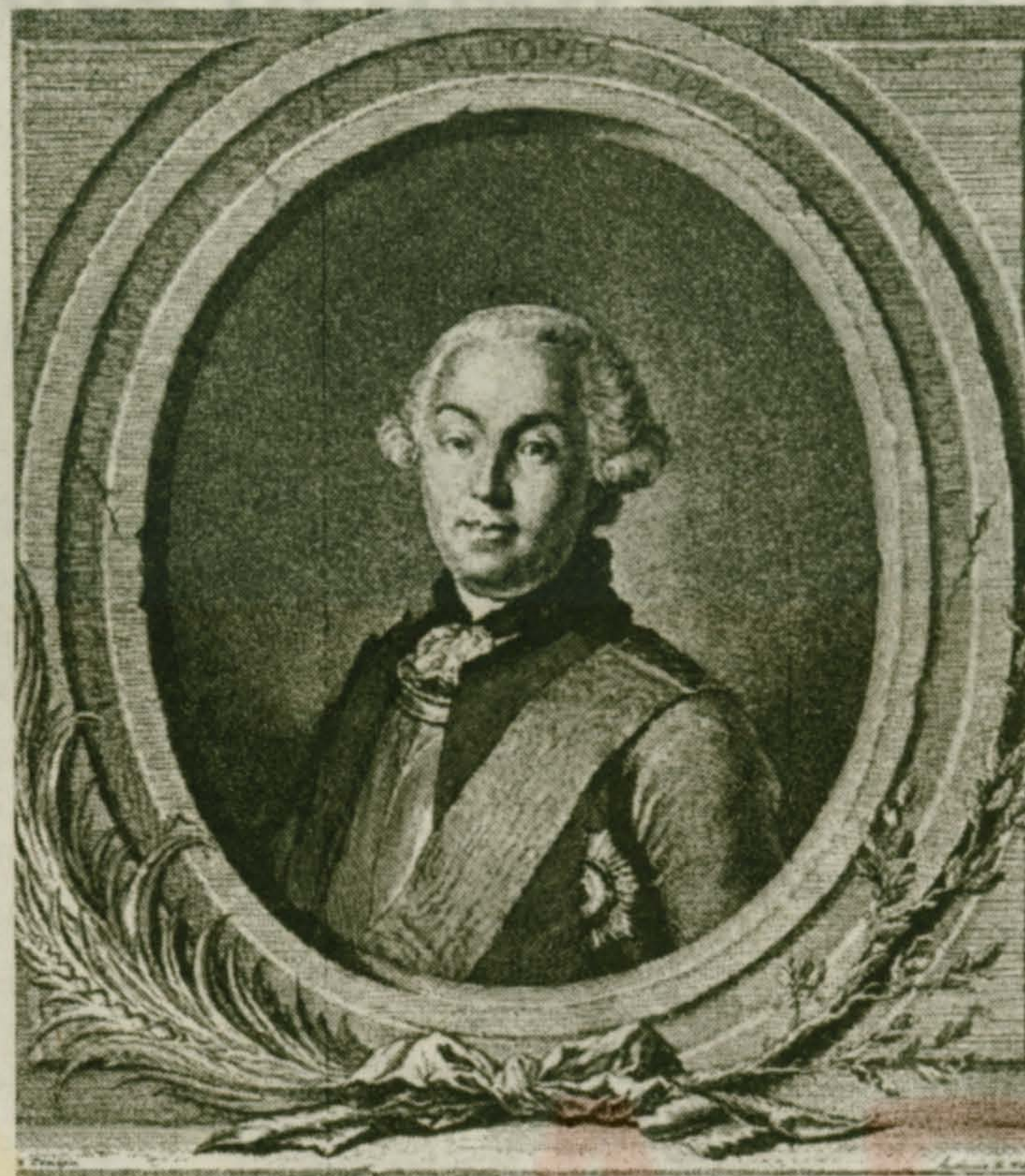
Е. Чемесов. Граф Г. Г. Орлов