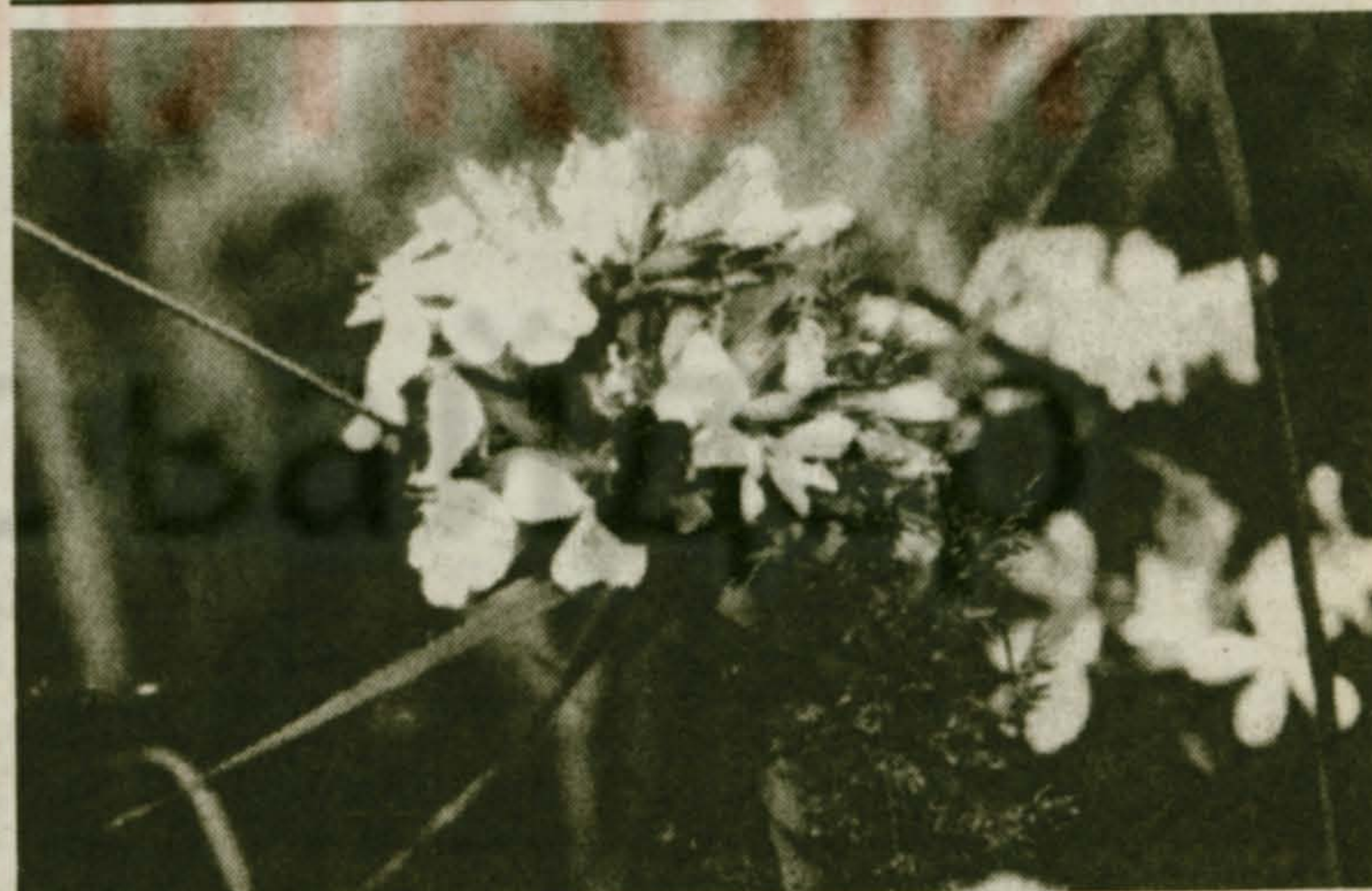
«Мохнатый шмель на душистый хмель»

Продукты: 3 пучка молодой свеклы с листьями, 2 ст. ложки рубленого укропа, 3 свежих огурца, 4 ст. ложки сметаны, 1,5 литра кваса, соль.