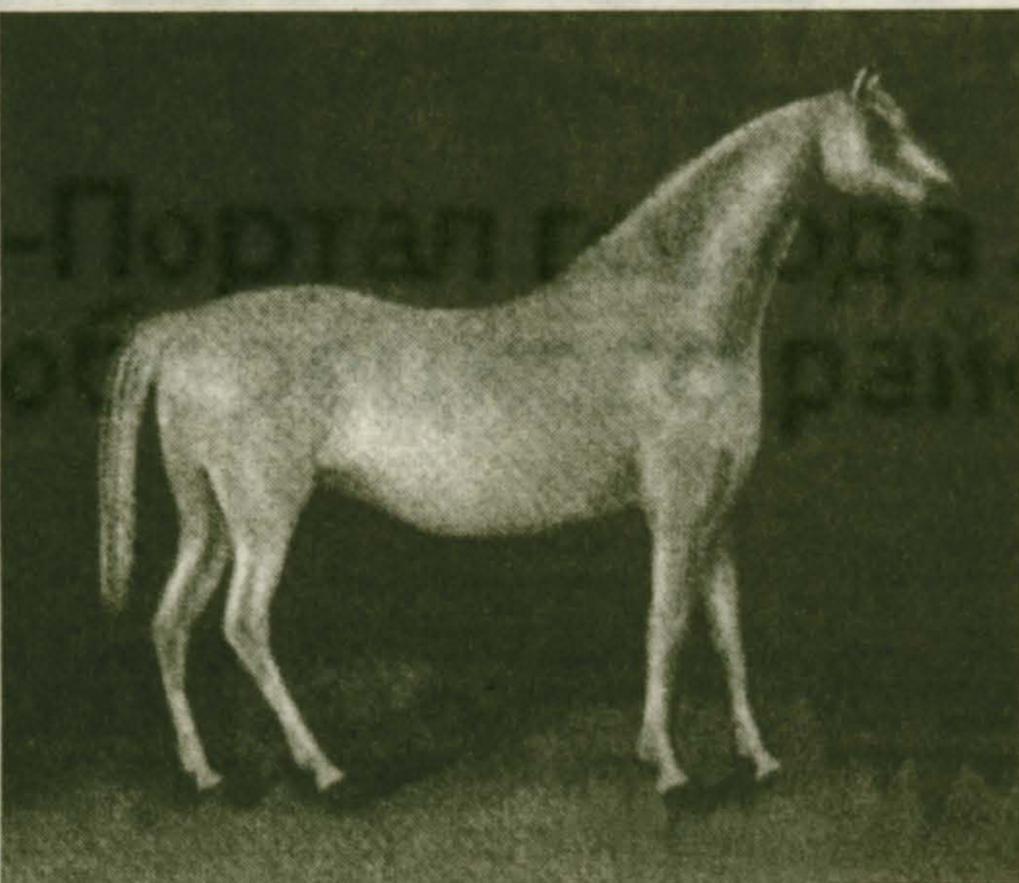
Портрет Сметанного. XVIII в.

теи. /Веретя — по В. И. Далю, род природного вала, какие бьют на луговой стороне рек, в несколько рядов и с поперечными прорывами — прим. автора/. У истока, бравшего начало из Березового болота возле деревни Новиковой /существовала когда-то и такая! — прим. автора/ был