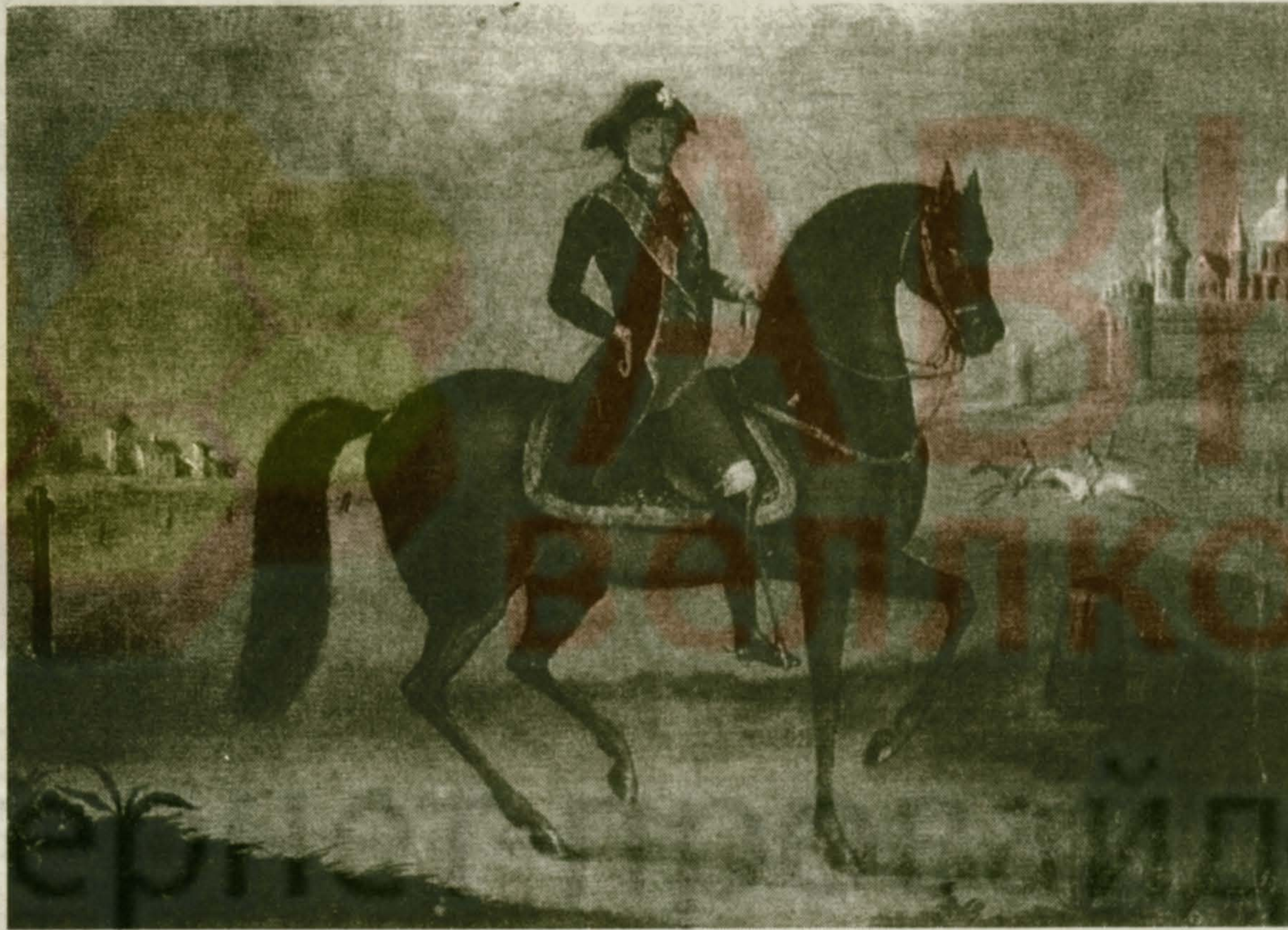
А.Г. Орлов-Чесменский на Свирепом орловской верховой породы. П.Д. Невзоров. Конец XVIII в.

теи. /Веретя — по В. И. Далю, род природного вала, какие бьют на луговой стороне рек, в несколько рядов и с поперечными прорывами — прим. автора/. У истока, бравшего начало из Березового болота возле деревни Новиковой /существовала когда-то и такая! — прим. автора/ был