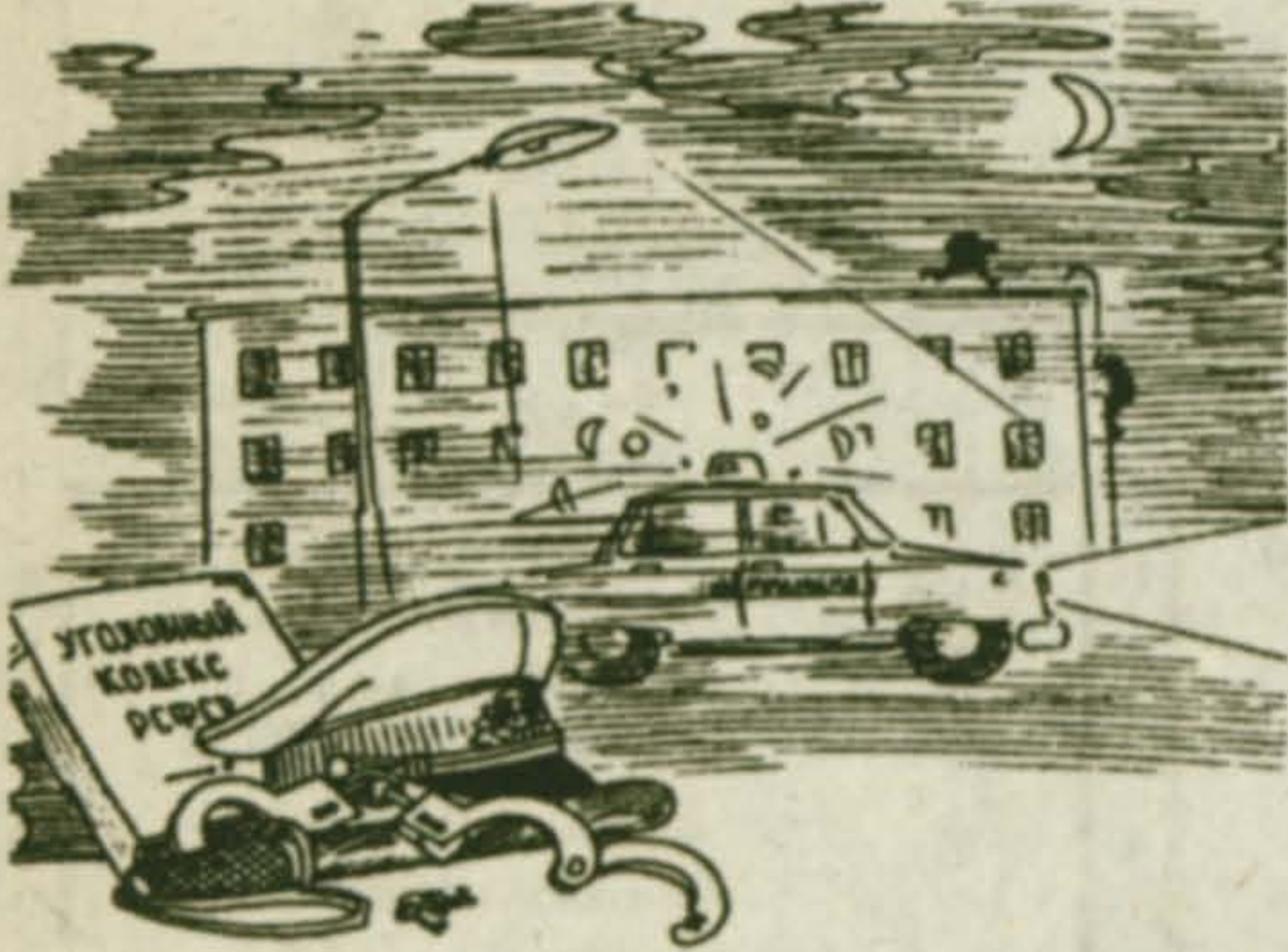
(Продолжение. Начало в № 46).

3 ноября в лесном массиве карьера Волкуша обнаружен труп неизвестного мужчины без внешних признаков насильственной смерти.