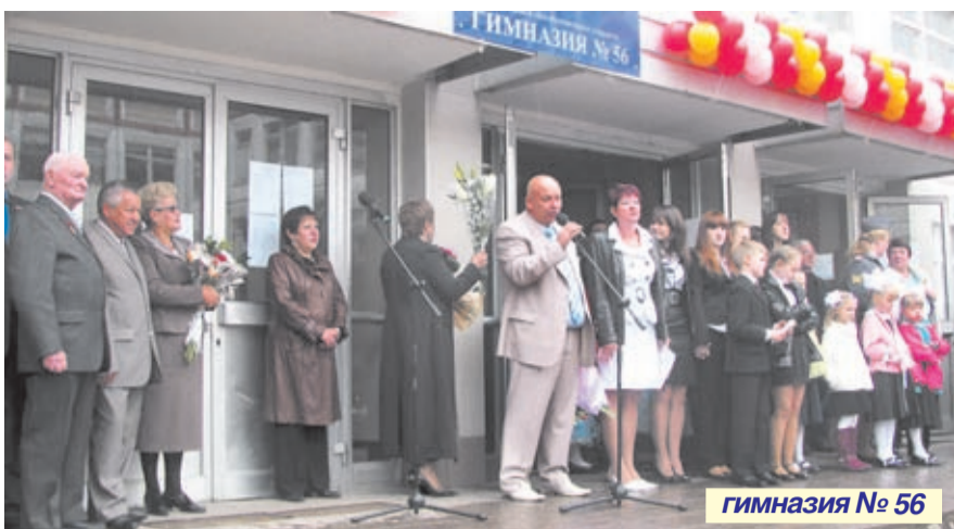
гимназия № 56