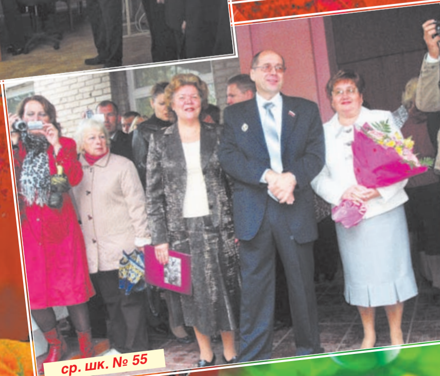
ср. шк. № 55