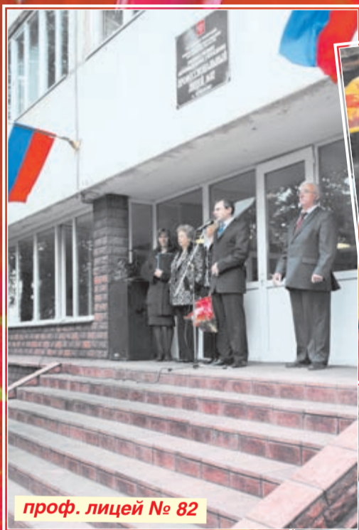
проф. лицей № 82