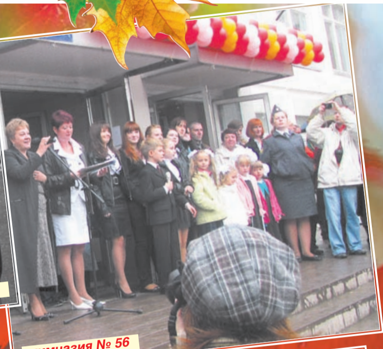
гимназия № 56