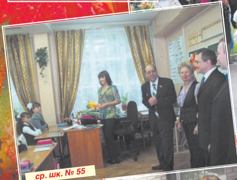
ср. шк. № 55