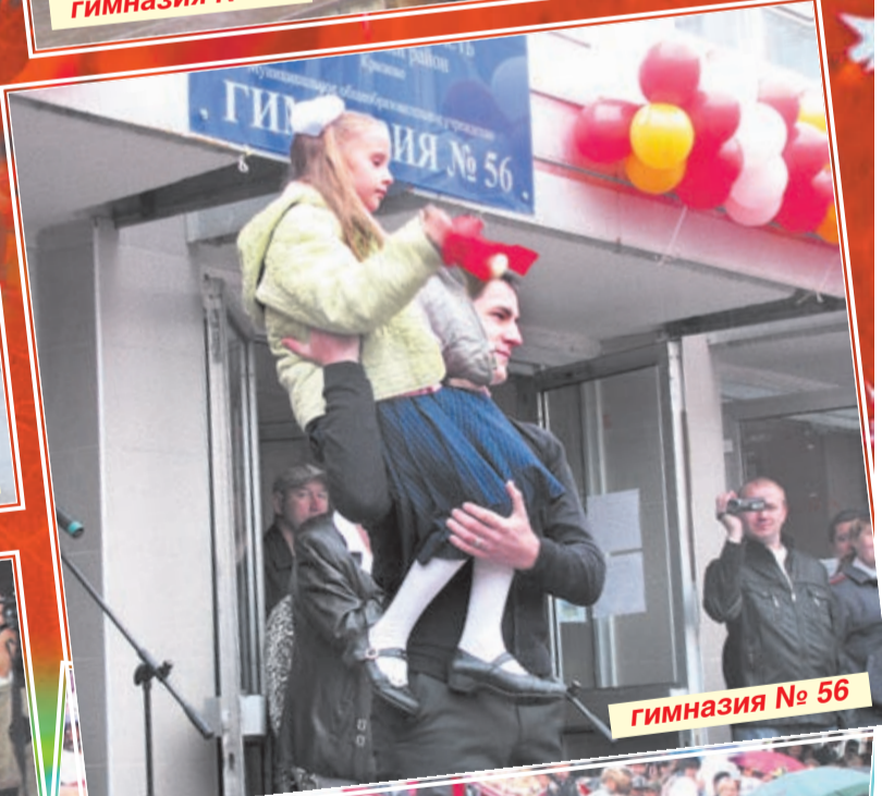
гимназия № 56