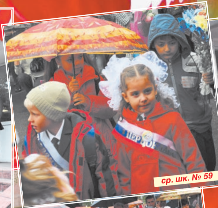
ср. шк. № 59