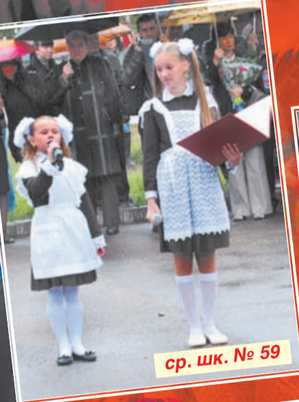
ср. шк. № 59