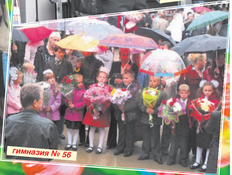
гимназия № 56