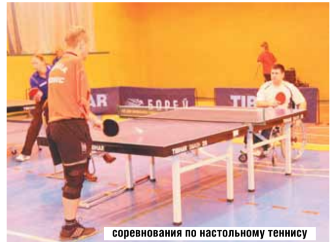
соревнования по настольному теннису