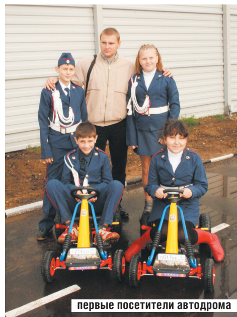
первые посетители автодрома