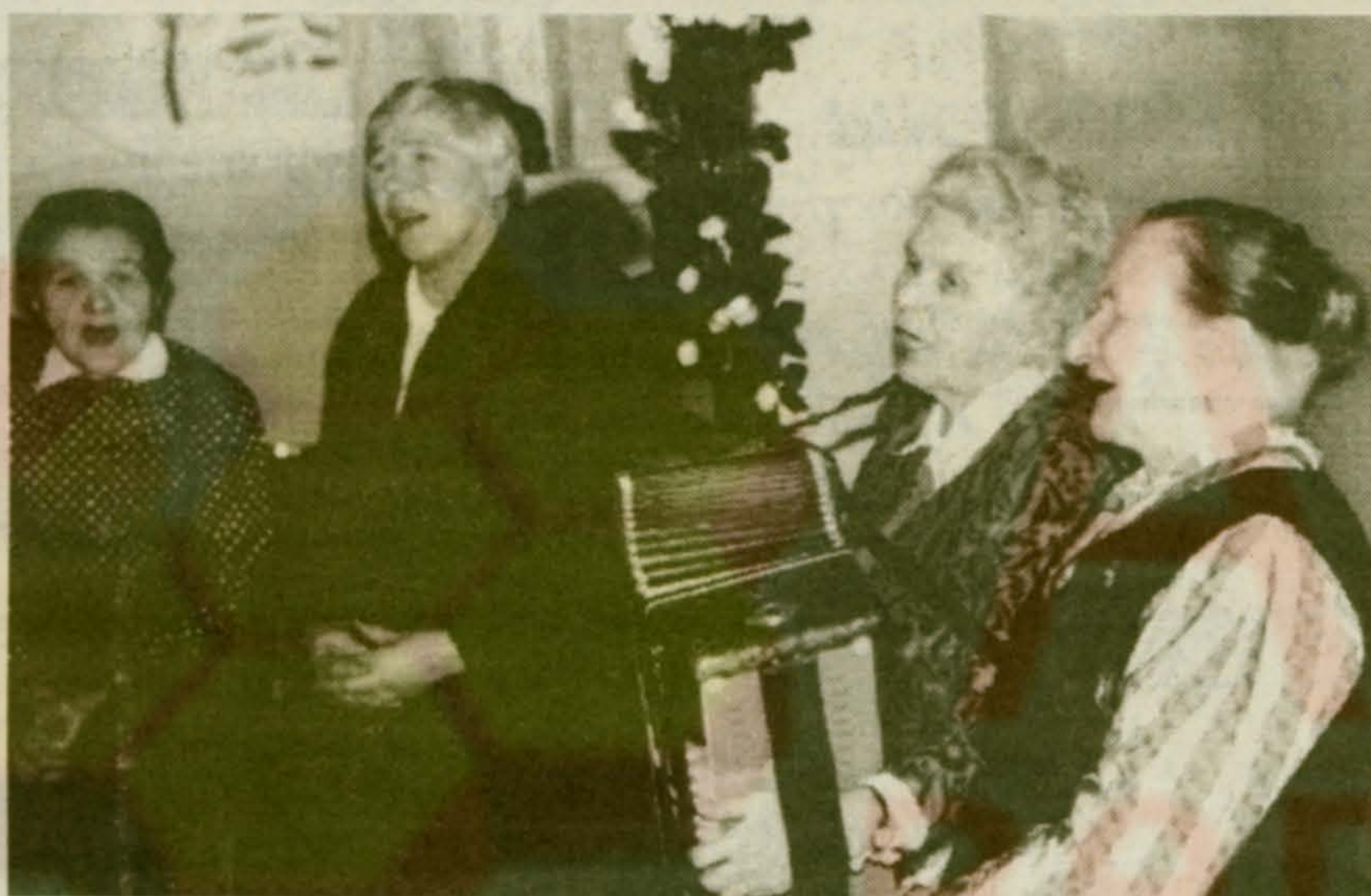
Идет репетиция хора ветеранов