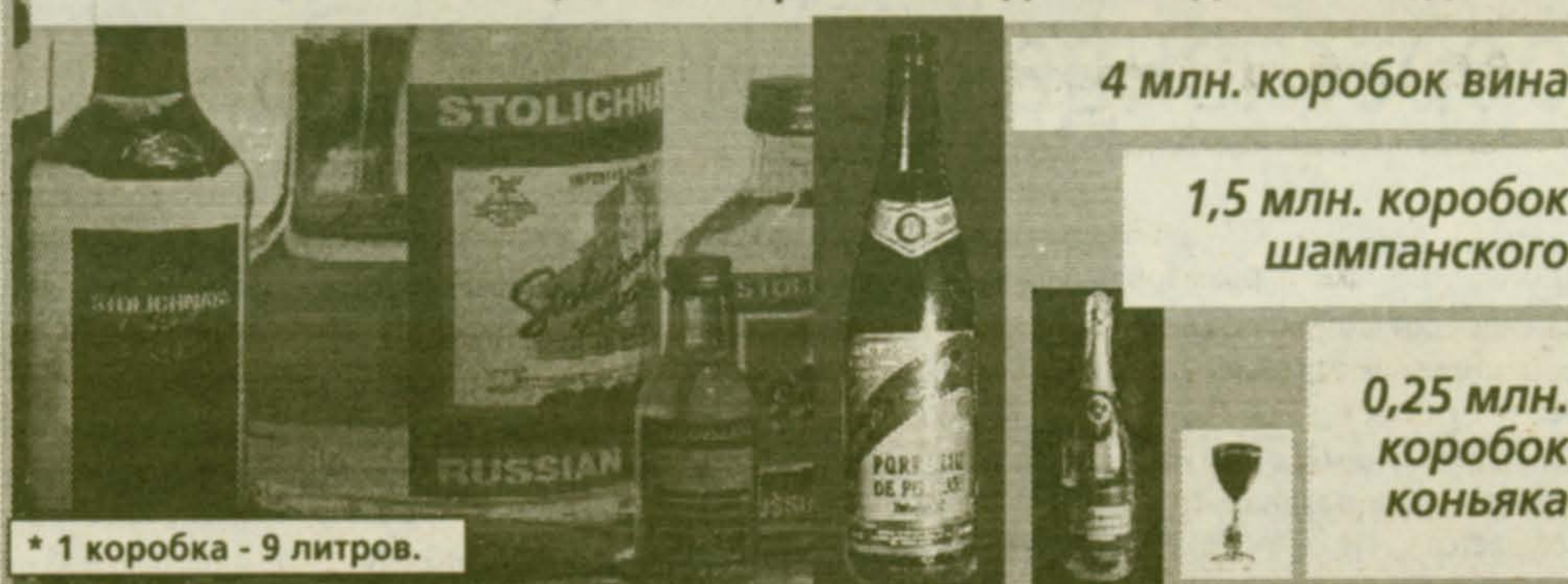
* 1 коробка - 9 литров.

"Славянская" за "круглым столом", чтобы обменяться мнениями по поводу грядущего нововведения. Свою точку зрения изложили ГАК РФ, "Росалко", "Ростест", МВД, Минэкономики, Союз потребителей, представители ЕС. К сожалению, за "круглым столом" отсутствовали сами герои дня - представители московского правительства. Абсолютную нетерпимость положения, сложившегося на рынке алкоголя, признавали все выступавшие. Однако столь же дружно критиковалась инициатива московских властей. Почему?