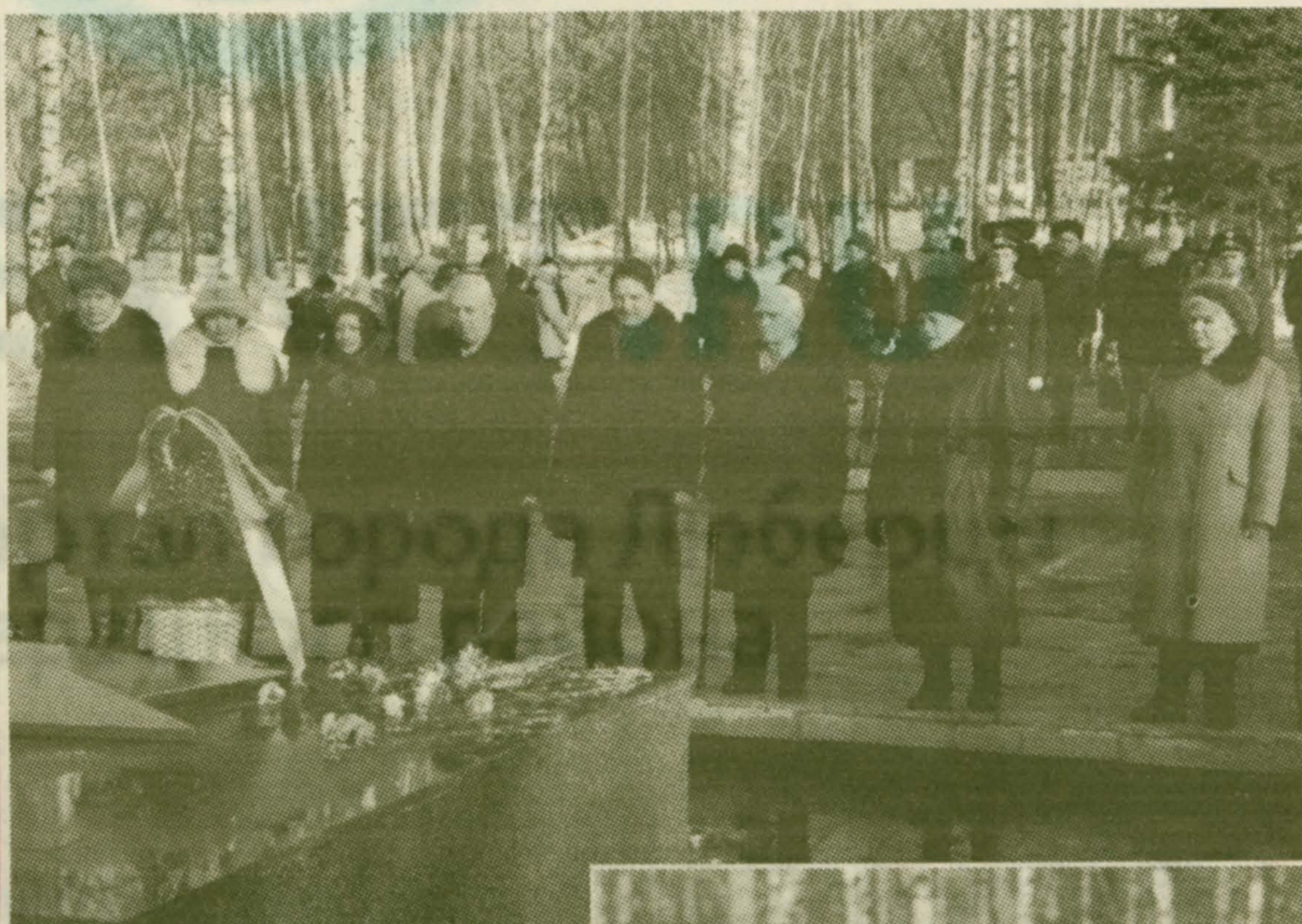
23 февраля в День защитников Отечества на мемориальном комплексе в Сквере Победы состоялось возложение цветов.

10 часов утра. Строгие лица молодых солдат, сегодняшних защитников российских рубежей, застывших в почетном карауле. Печально-радостные глаза ветеранов, которые не щадили своих жизней в годы Великой Отечественной войны, отстаивая свободу и независимость нашей Родины — огромной страны под названием Советский Союз. Улыбки на лицах тех, кого еще только в будущем станут называть защитниками Отечества. И ветераны, до конца выполнившие свой долг на полях сражений, и молодежь, готовая принять эстафету у старшего поколения и исполнить почетную обязанность по защите государства в мирное время, стоят в едином строю.