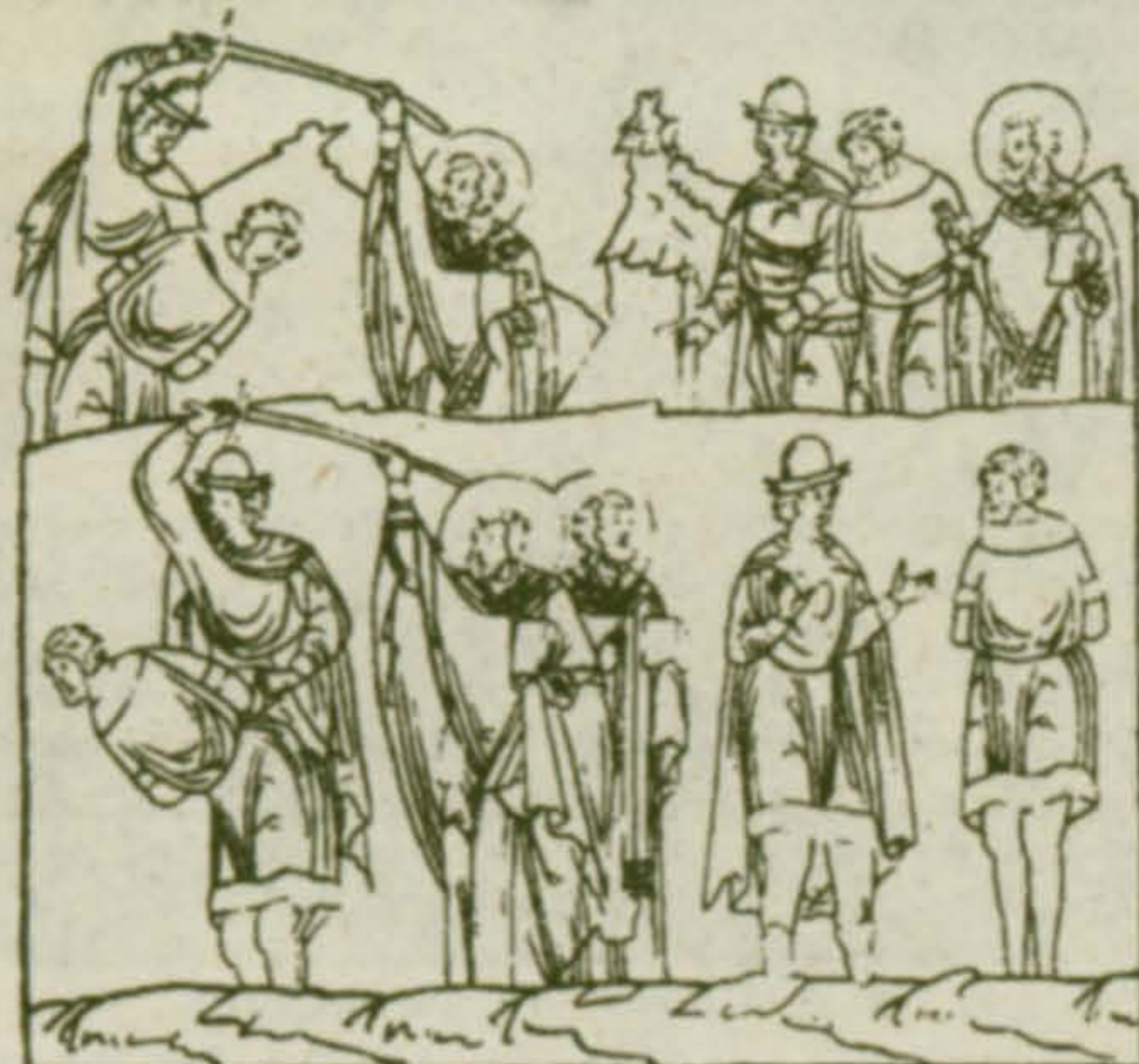
Св. Николай избавляет от меча Христофора