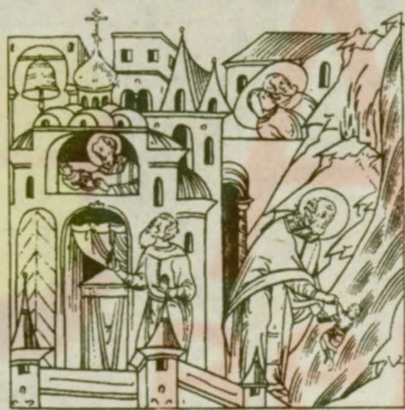
Святой спасает младенца из реки

Как и при жизни, Святой Николай продолжал помогать несправедливо заключенным в тюрьму, осужденным на казнь и пленникам. Описаны случаи освобождения от уз св. Иосифа Песнописца и военачальника Петра Афонского в IX веке; освобождение Василия, сына грека Агрика, из арабского плена чудесным перенесением его домой; освобождение сарацина (араба) из тюрьмы в греческом г. Сполитисе; избавление из темницы отрока, посаженного своим хозяином Епифанием из-за ложного подозрения в краже; спасение священника Христофора, взятого в плен аравитянами, от казни (Святой трижды невидимо отнимал меч у палача). Много подобных случаев произошло и на Руси. Примером может служить освобождение из плена в Золотой орде крещеного татарина Клеопы. Уверовавший в Христа знатный татарин бежал к русичам, женился на русской и многие годы служил верой и правдой Суздальскому князю. Клеопа был направлен в Орду для улаживания возникших затруднений, но когда цель была уже почти достигнута, один старый ханский вельможа узнал его. Клеопу заключили в тюрьму и долго истязали, принуждая снова принять язычество. Ничего не добившись, татары решили его казнить. Клеопа в ночь перед казнью молился Богу и призывал на помощь Святого Николая. И произошло чудо. Явился Чудотворец, прикосновением руки раздробил оковы страдальца и велел следовать за собой. Двери темницы распахнулись, и Святой увел Клеопу далеко от ханской ставки.