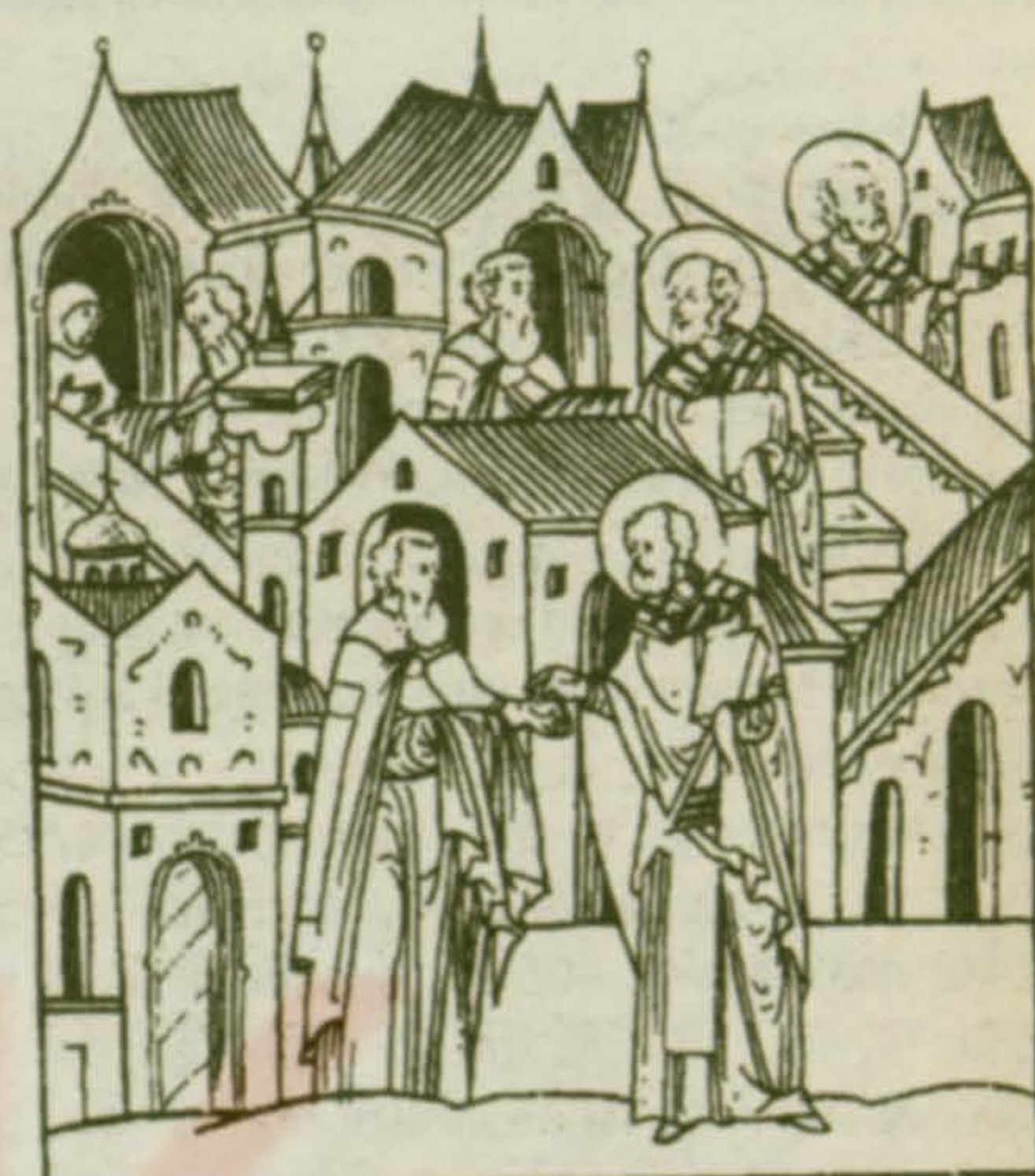
Святой покупает ковер у мужа