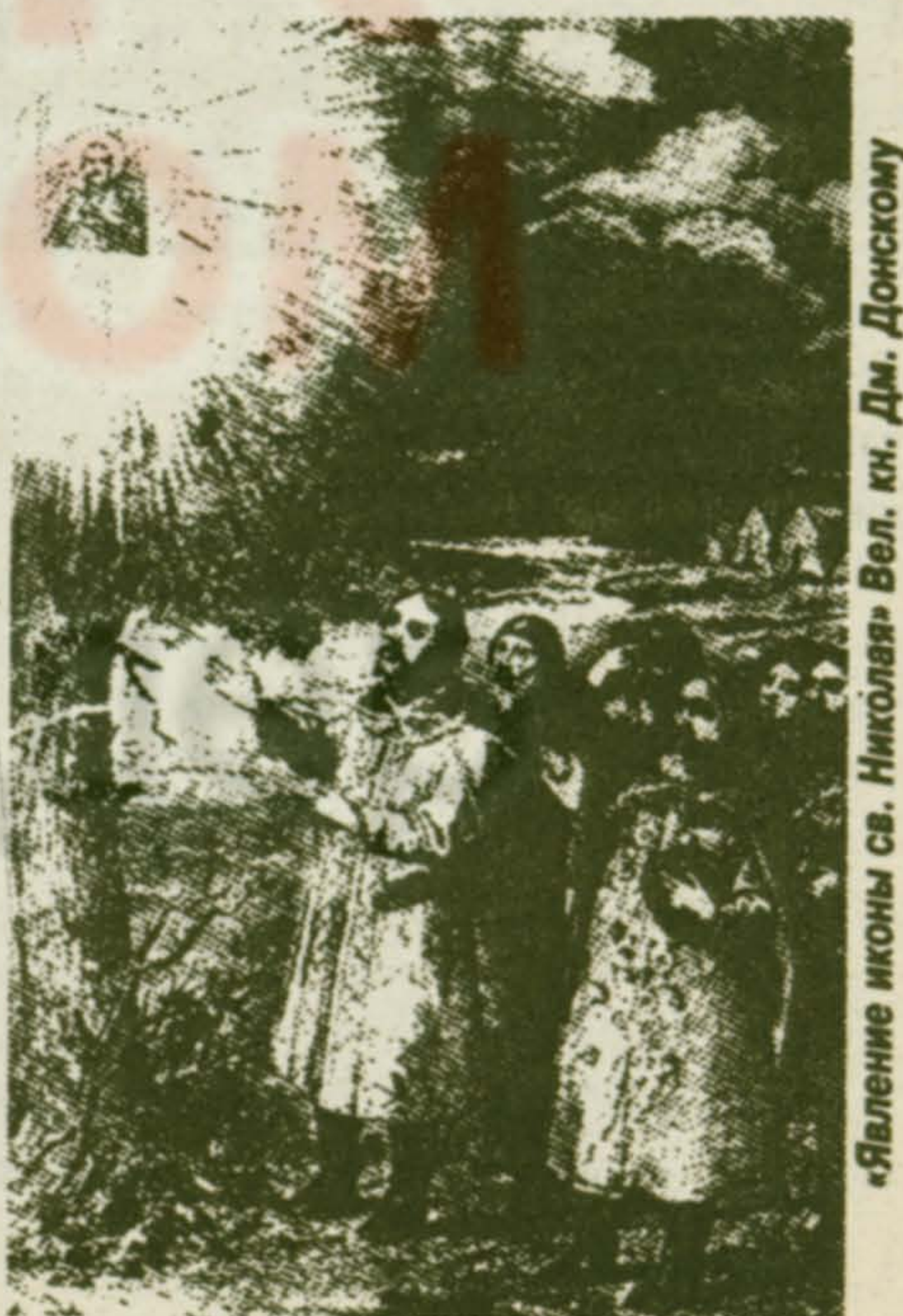
«Явление иконы св. Николая» Вел. кн. Дм. Донскому