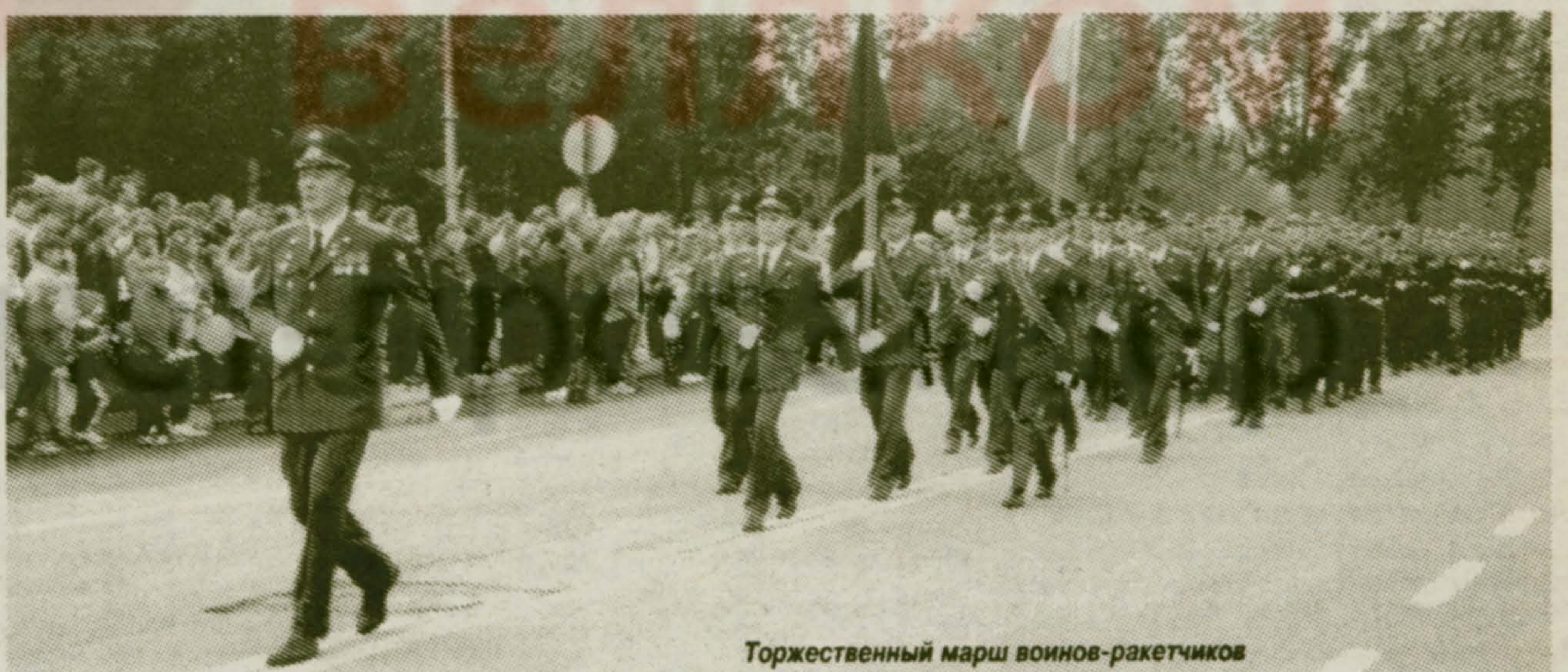
Торжественный марш воинов-ракетчиков