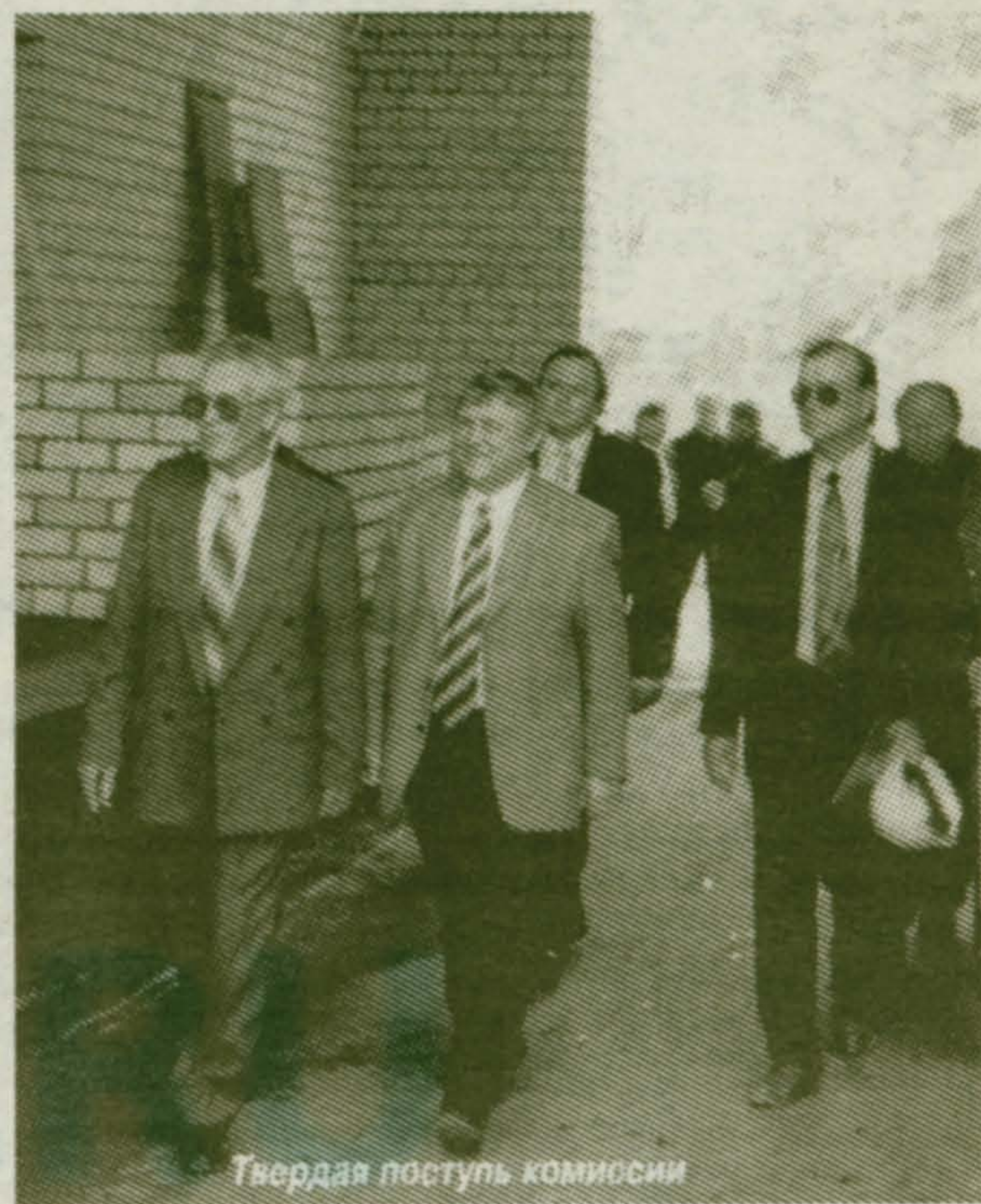
Твердая поступь комиссии