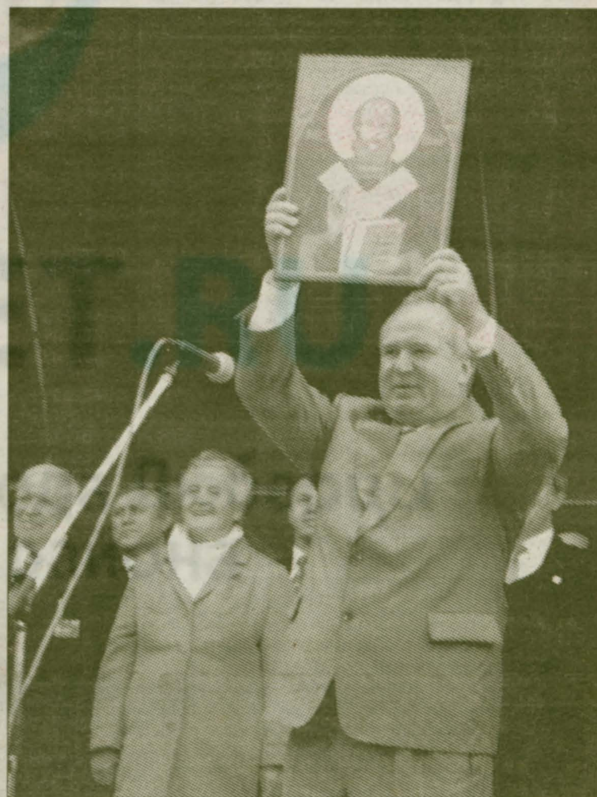
В руках мэра города икона Святителя Николая — подарок наших друзей из города Монтаны

Репортаж о праздновании Дня города читайте на с. 2, 7, 8, 9, 10