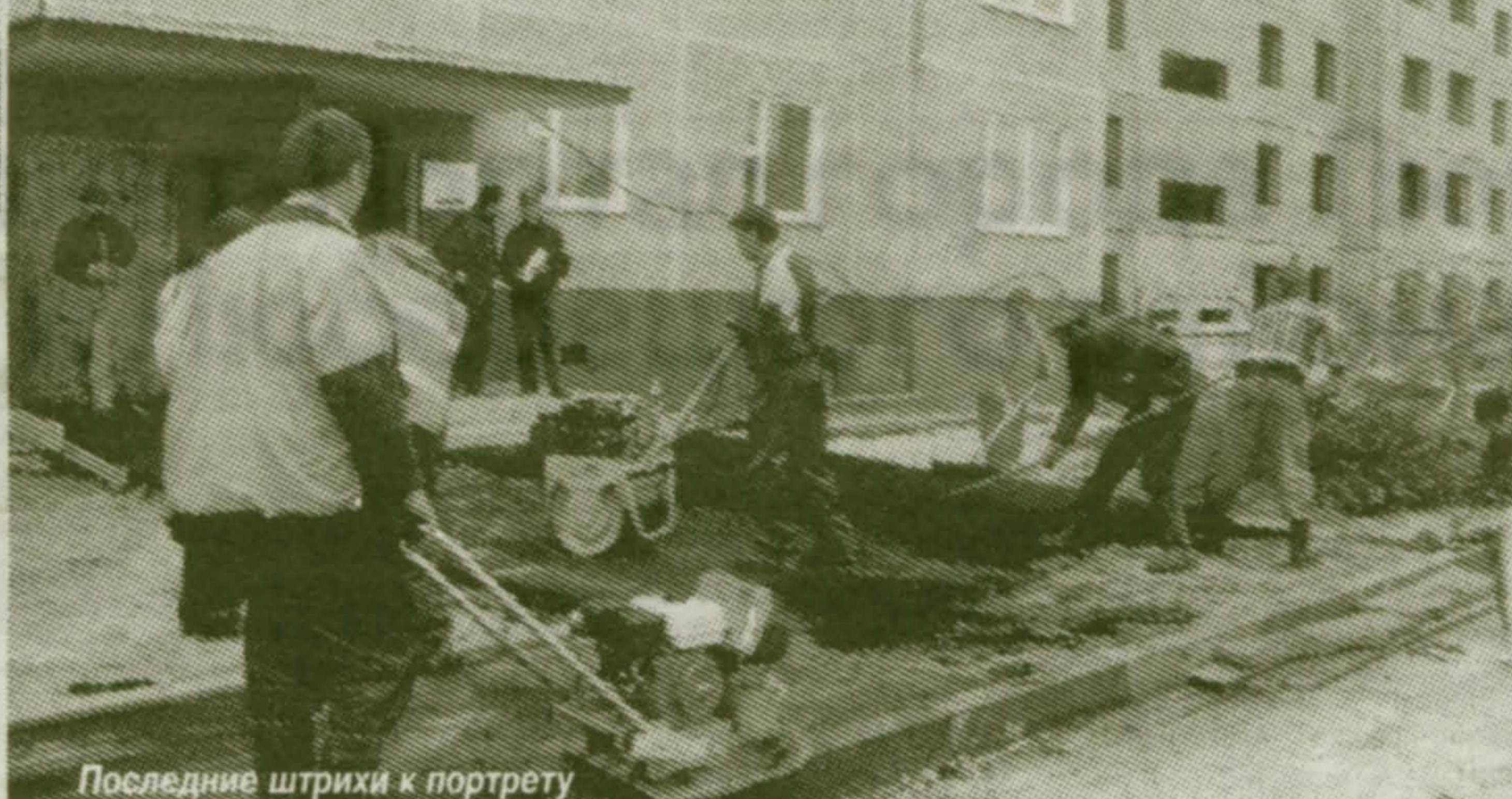
Последние штрихи к портрету

Новый кирпичный дом-вставка выделяется своим внешним видом даже среди красивых современных домов на ул. Лесной. О его достоинствах можно было написать роман, не только статью. Скажу лишь о трехслойных стенах, роскошной планировке квартир (кухни 22 кв. мет-