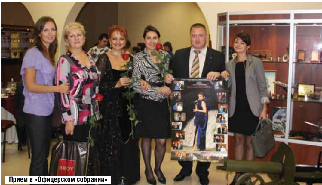
Прием в «Офицерском собрании»