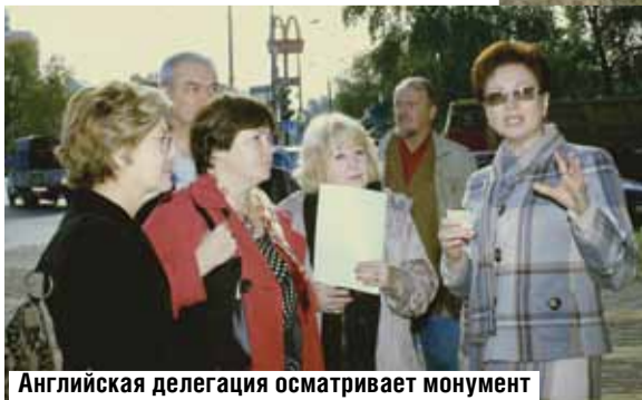
Английская делегация осматривает монумент