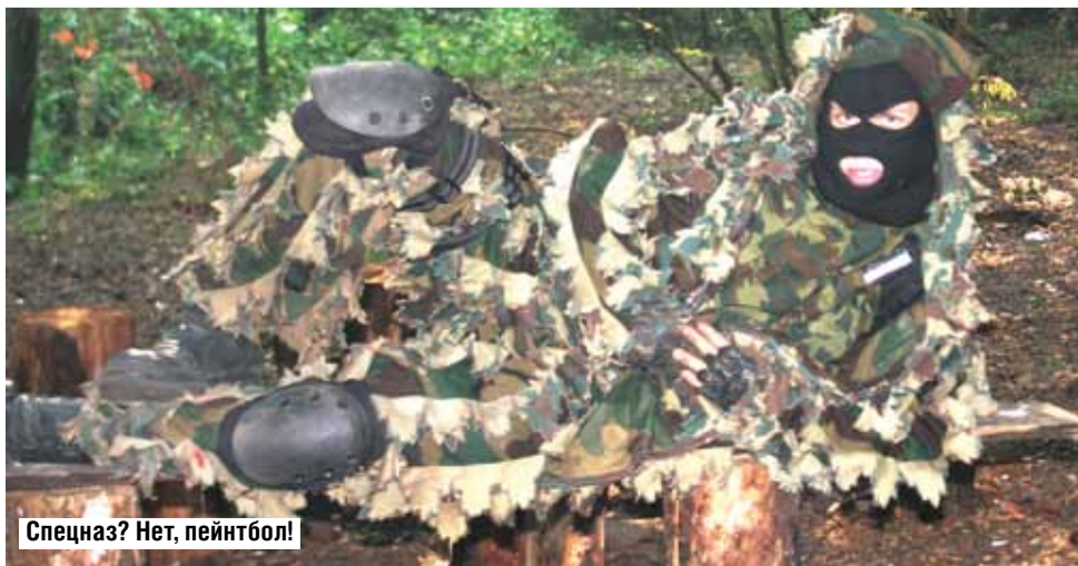
Спецназ? Нет, пейнтбол!