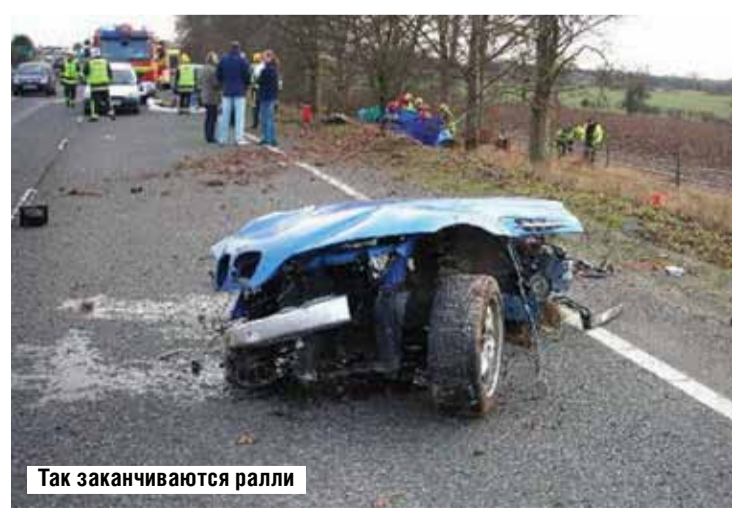
Так заканчиваются ралли