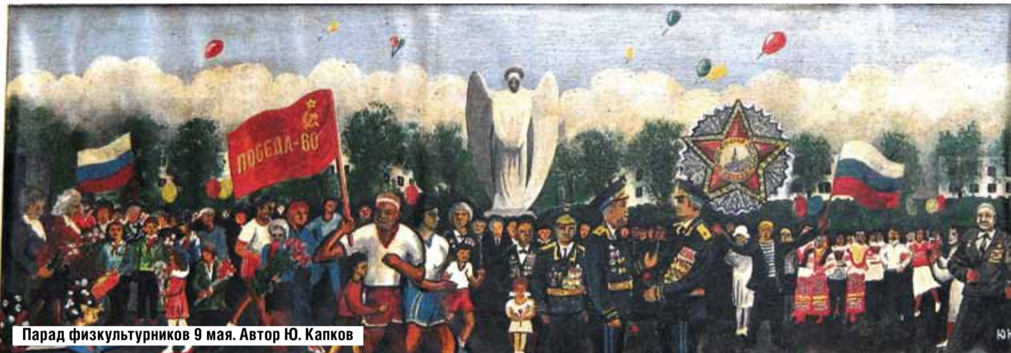
Парад физкультурников 9 мая.