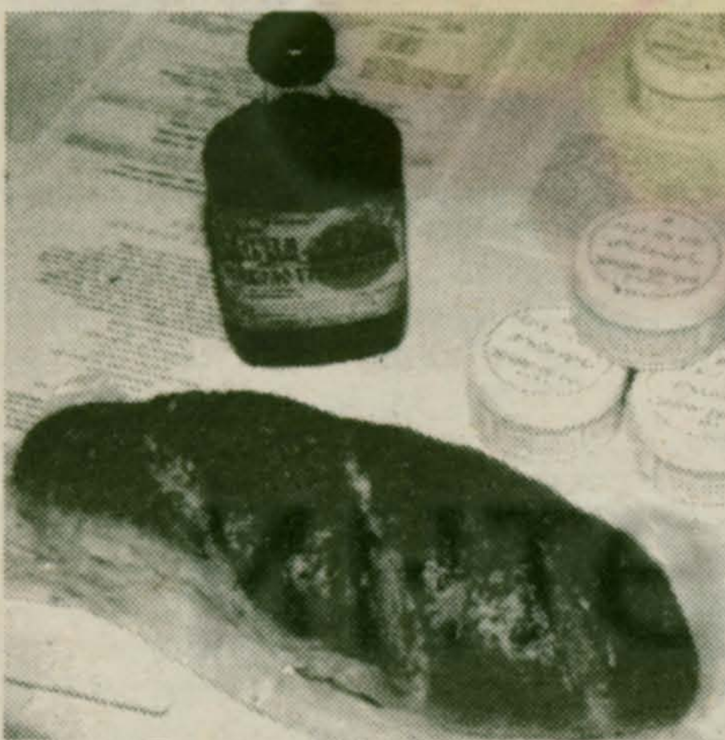
Продукция ФЦДТ «Союз»

В Россию это движение пришло в 1996 году. Инициативу поддержали