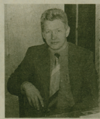
Остался позади отопительный сезон 1997-1998гг. Можно смело сказать, что работники Томилинского МПЖХ...

Торжества, как всегда, закончились выступлением певчих в исполнении самодеятельных артистов ансамбля.