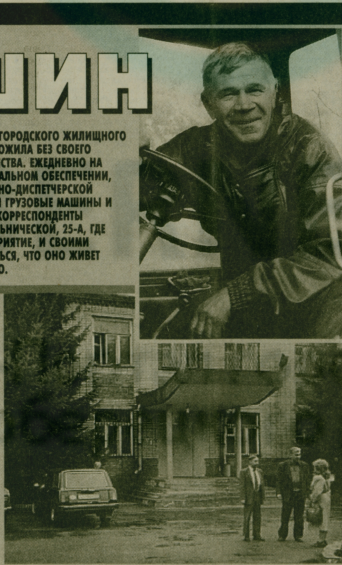
нельзя даже представить себе нормальную жизнь городских жилищно-коммунальных служб. Счастливого пути!

Даже здесь, в Токареве, недалеко от нашего завода, немало пустующих помещений. Вот я и прикинул: а разве плохо было бы перевести их под выращивание вешенки? Тем более, что в этом случае баню удалось бы полностью использо-