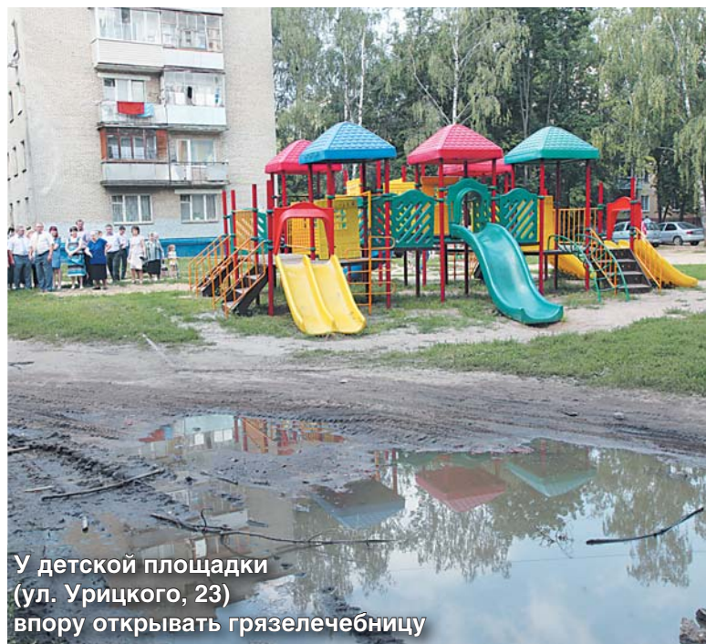
У детской площадки (ул. Урицкого, 23) в пору открывать грязелечебницу