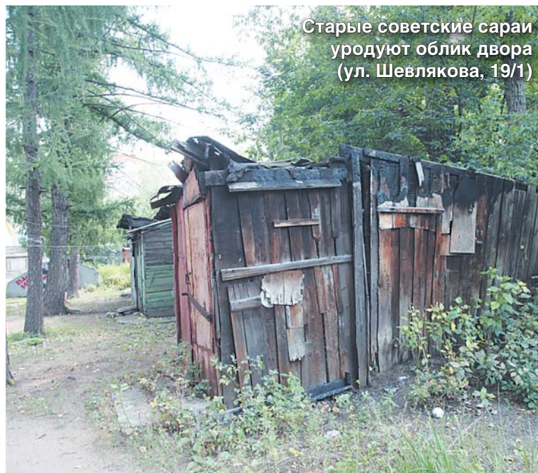
Старые советские сараи уродуют облик двора (ул. Шевлякова, 19/1)