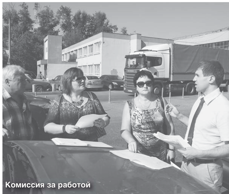
Комиссия за работой

В минувшую среду состоялся выезд рабочей группы на территорию бывшего завода им. Ухтомского. В состав группы вошли представители люберецкого «Водоканала», «Теплосети» и сотрудники администрации.