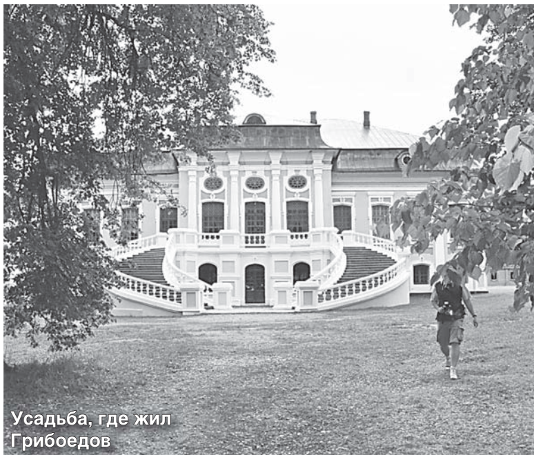
Усадьба, где жил Грибоедов