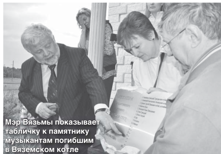
Мэр Вязьмы показывает табличку к памятнику музыкантам погибшим в Вяземском котле

сту сжигает...» И ещё — «любой человек, постоявший некоторое время на этом месте, получит большую подпитку энергией. Ну, а если случится кому-нибудь найти Алатырь-камень, то вместе с камнем найдет этот человек и бессмертие».