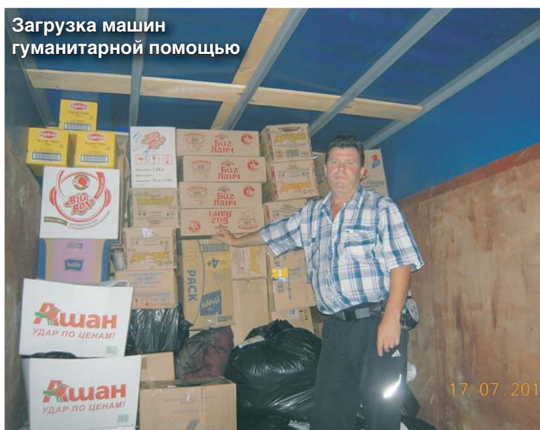
Загрузка машин гуманитарной помощью