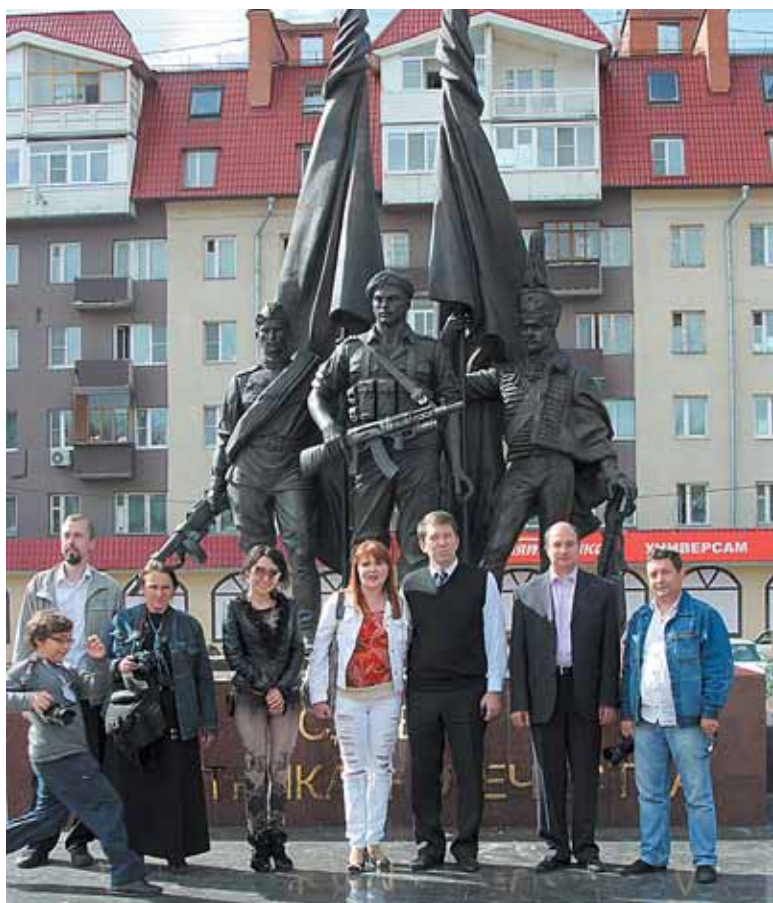
Дорожные впечатления: Дворцовая площадь в Лыткарине, Николо-Угрешский монастырь в Дзержинском. Фоторепортаж Светланы Самченко и Константина Кирихина