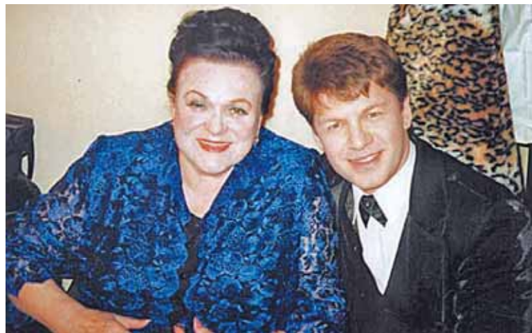
С Великой русской певицей Людмилей Зыкиной.

– Молодых исполнителей романсов действительно мало. Романсы надо петь проникновенно, их нужно чувствовать сердцем и душой. Наверное, молодёжи «некогда» этому учиться!