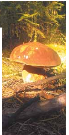
Снимки сделаны 15 сентября