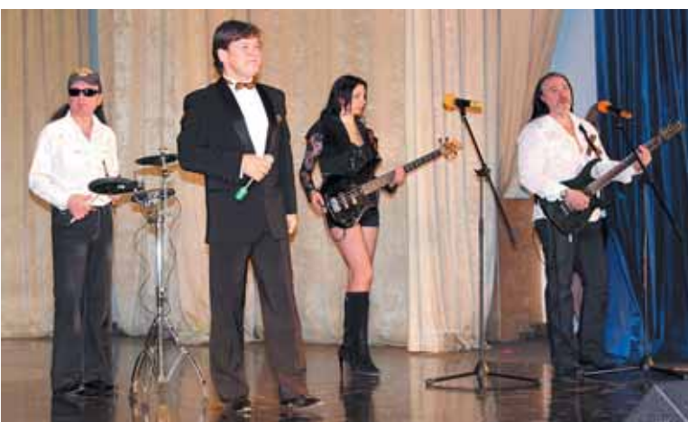
Концерт в Красковском культурном центре, май 2012 г.

спектаклях играл без замены. Репетируя их, я днём и ночью пропадал в институте. После окончания ГИТИСа полгода отыграл на сцене Московской оперетты, но эстрада переманила!