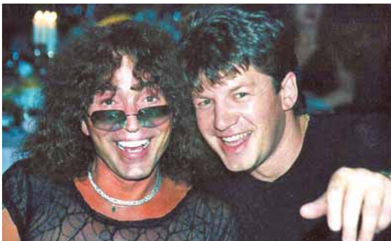
С популярным эстрадным артистом Валерием Леонтьевым.