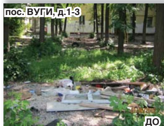
пос. ВУГИ, д.1-3