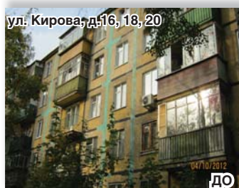
ул. Кирова, д.16, 18, 20