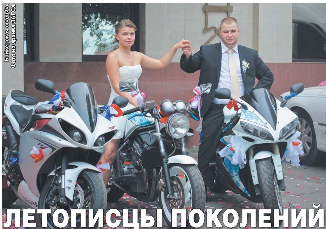
Байерская свадьба