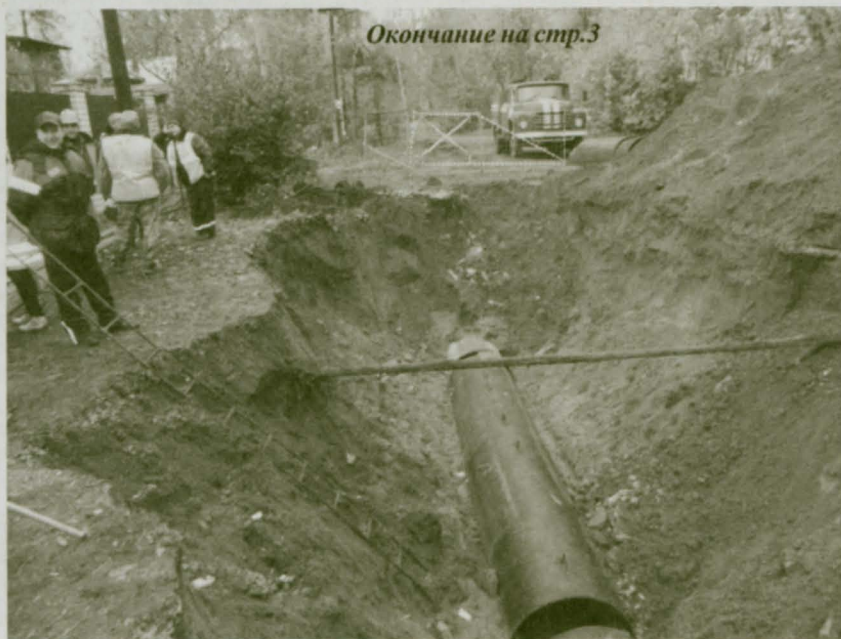
Окончание на стр.3

- И насколько типично для Малаховки то, что труба более сорока лет спокойно лежала в первозданном виде и потом в один момент выдала подобный «фортель»? И не может ли подобная авария произойти в любой части поселка?