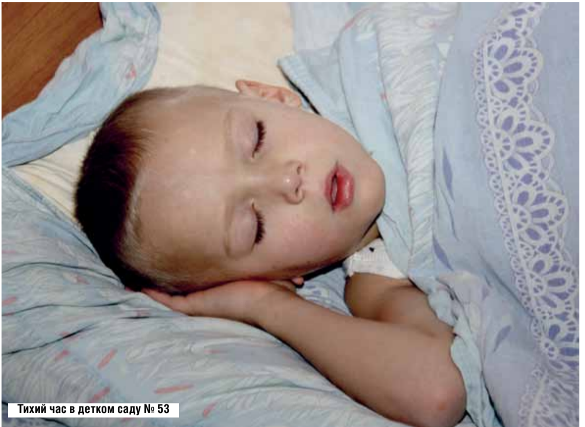
Тихий час в детском саду № 53