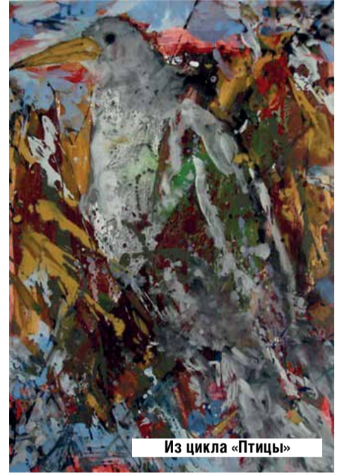
Из цикла «Птицы»

- Я могу завидовать, могу восхищаться или не принимать кого-нибудь из коллег, но кто может занять моё место? Никто! Да и мне