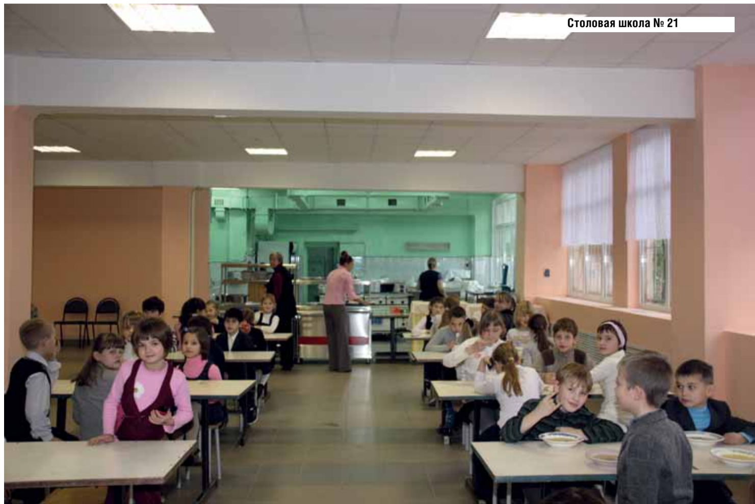
Столовая школа № 21