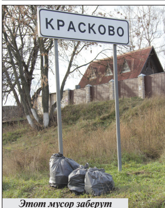
Этот мусор заберут

Красковчане с радостью отмечают: в течение нынешнего года в поселке стало больше порядка. Летом высаживались цветы на клумбах, подметались