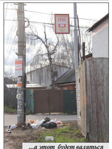
...а этот будет валяться

— Завяжите свой мусор в черный плотный пакет и оставьте возле дома. Водитель заберет. Но собирать россыпи на обочинах ему некогда, так что постарайтесь, чтобы пакет был целым! Пользуясь случаем, прошу