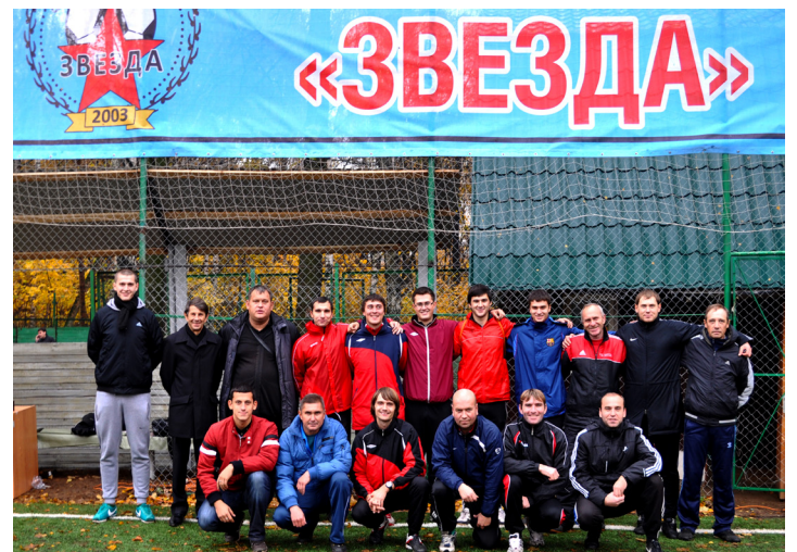
Тренерский состав ДЮСШ «Звезда»