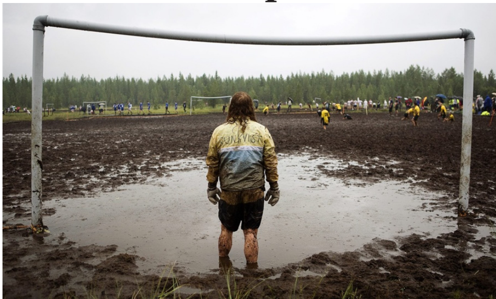
Россия перешла на систему «осень-весна»