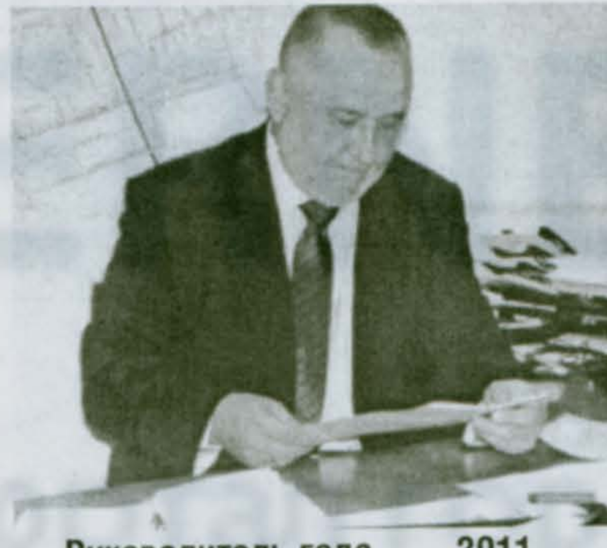
Руководитель года 2011

Время побед и свершений, Преодоления преград, В дружном своем коллективе Каждому дню ты рад