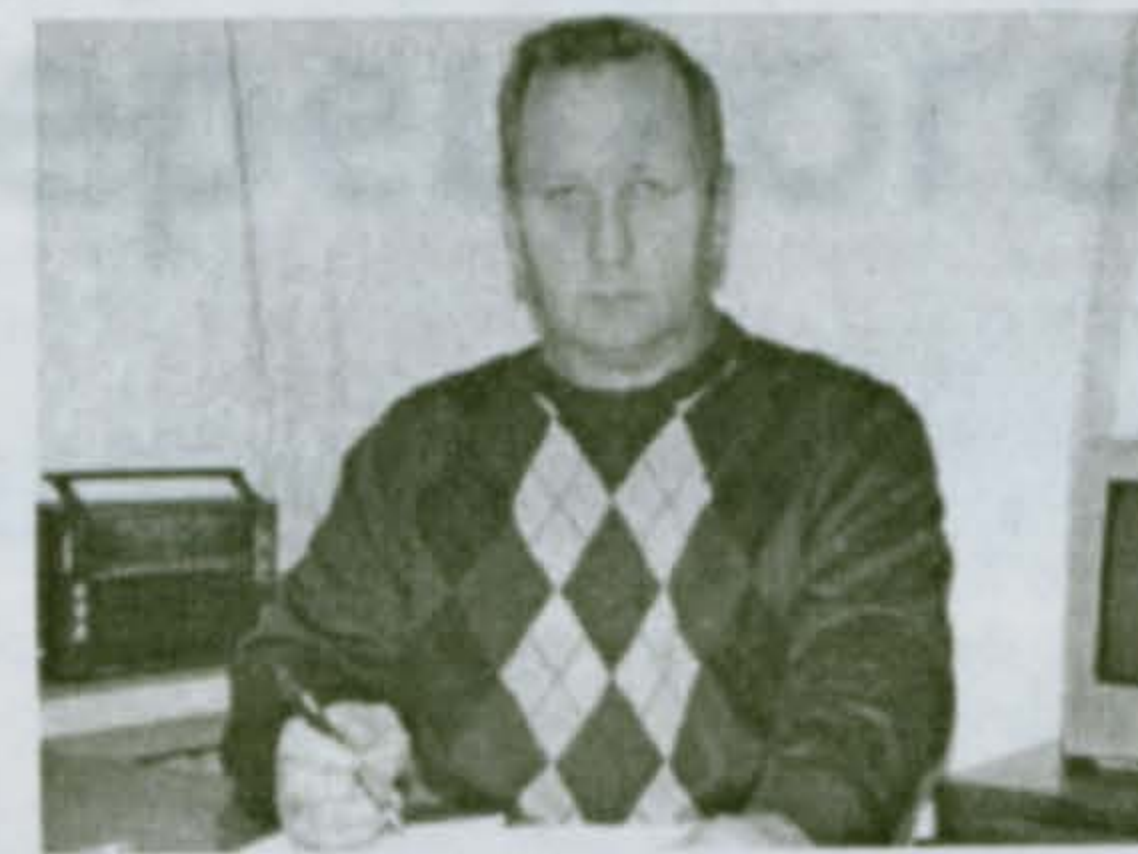
Главный инженер года 2011