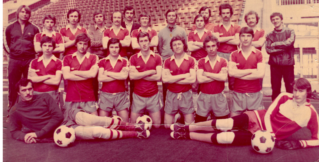
1983 год. Красногорский «Зоркий» в ЛФК ЦСКА во время предсезонных сборов.