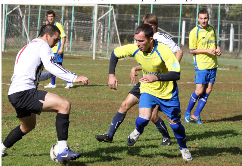
Матч «Звезда» - «Русские газоны»

добраться не так просто. Так что здесь полный порядок. Домашние игры проводим на стадионе в микрорайоне Силикат, а весной иногда играем на Белой Даче на стадионе «Здоровье»