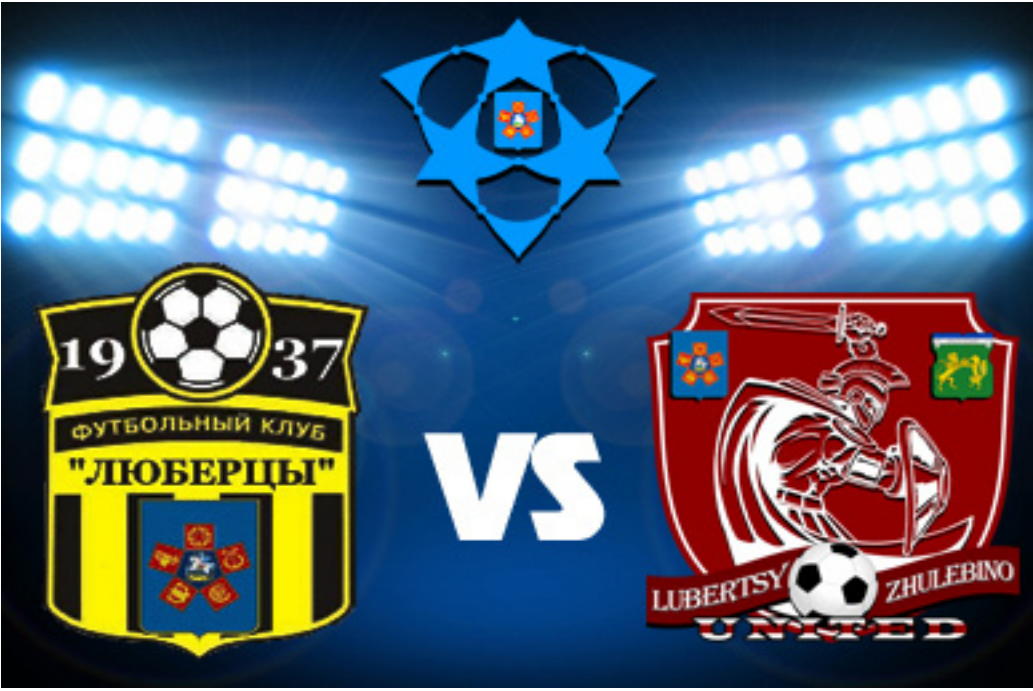
ФИНАЛ Первого Кубка ЛЛЛФ. 23 декабря, ст. «Звезда». Начало в 15:30.