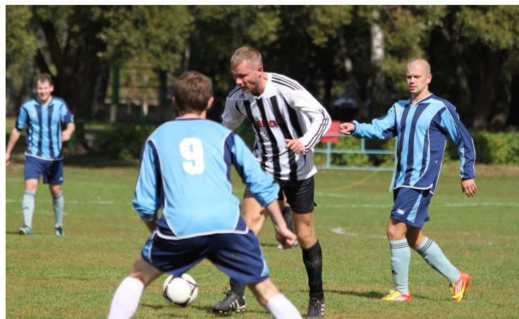
Матч «Лыткарино» - «Звезда»

Александр СЕРЕБРЕННИКОВ.