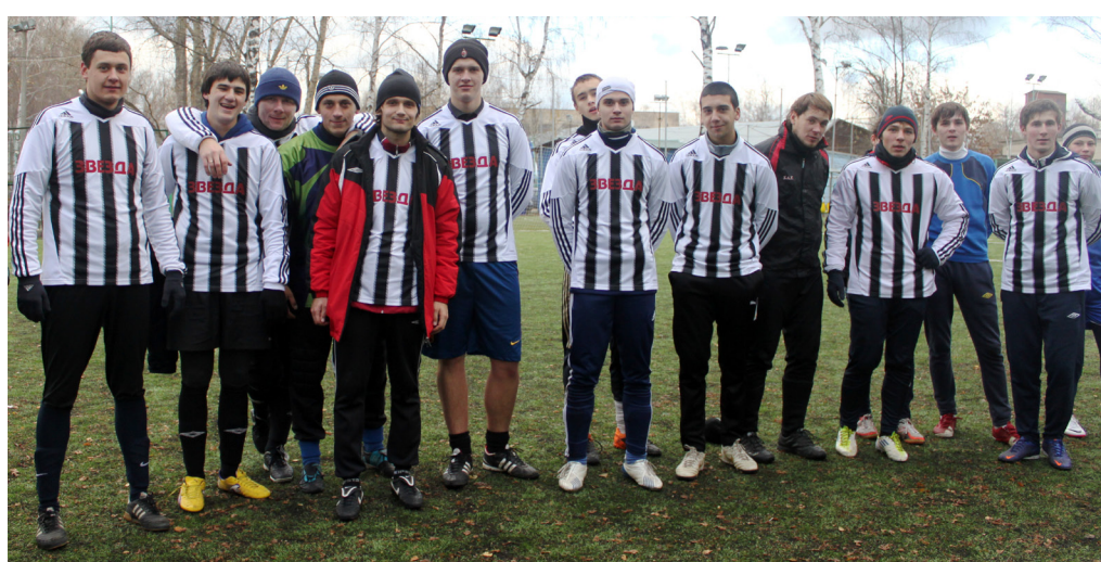
ФК «Звезда» Люберцы - победитель турнира «Осенний мяч - 2012»

- Позвоните за несколько дней, тогда сообщу точно.