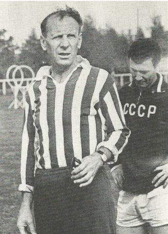
Старший тренер сборной СССР Николай Морозов, под руководством которого наша команда достигла 4-е место на чемпионате сборной по миру 1966 года в Англии.

дует учесть, что сборная СССР до сих пор играла по системе «дубль-в», в то время как