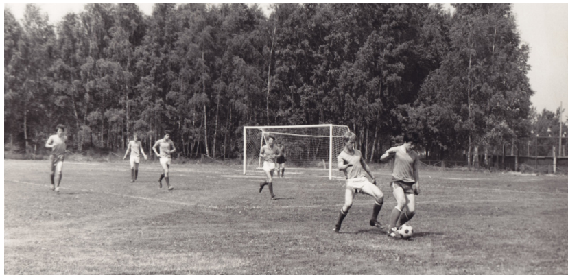
Футбольный матч на стадионе «Искра».