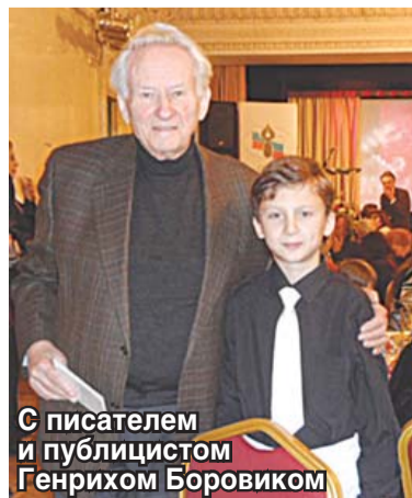
С писателем и публицистом Генрихом Боровиком