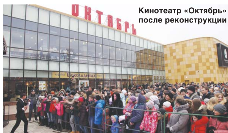
Кинотеатр «Октябрь» после реконструкции

Была решена самая острая проблема нового микрорайона 7-8 – отсутствие собственной квартальной котельной. Теперь весь микрорайон переведен на постоянную схему теплоснабжения, и жители больше не зависят от «московского тепла». Управляющими компаниями «ЛГЖТ» и «ЛУК» был выполнен значительный объем работ по ремонту кровель, герметизации межпанельных швов, ремонту внутрименовых инженерных коммуникаций, приведены в порядок территории и фасады зданий. Всего на эти