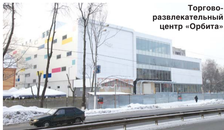
Торгово-развлекательный центр «Орбита»

Проведена огромная работа по установке общедомовых приборов учета энергоресурсов.