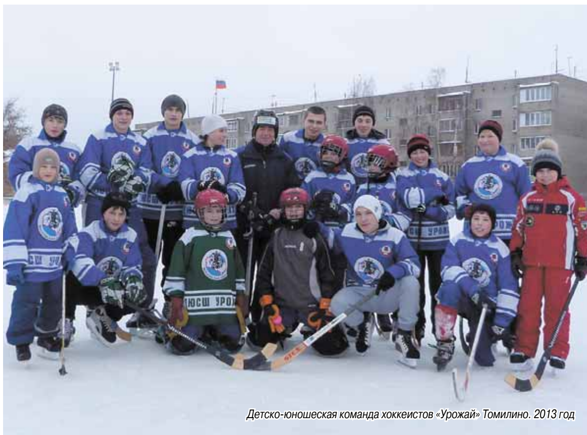
Детско-юношеская команда хоккеистов «Урожай» Томилино. 2013 год

стве Московской области. В 1970 году мы выиграли и чемпионат Московской области, и Кубок Московской области, а также Спартакиаду Московской области. Сделали своеобразный хет-трик: выиграли все, что можно было выиграть. Была очень сильная команда. В нашей команде были игроки – все