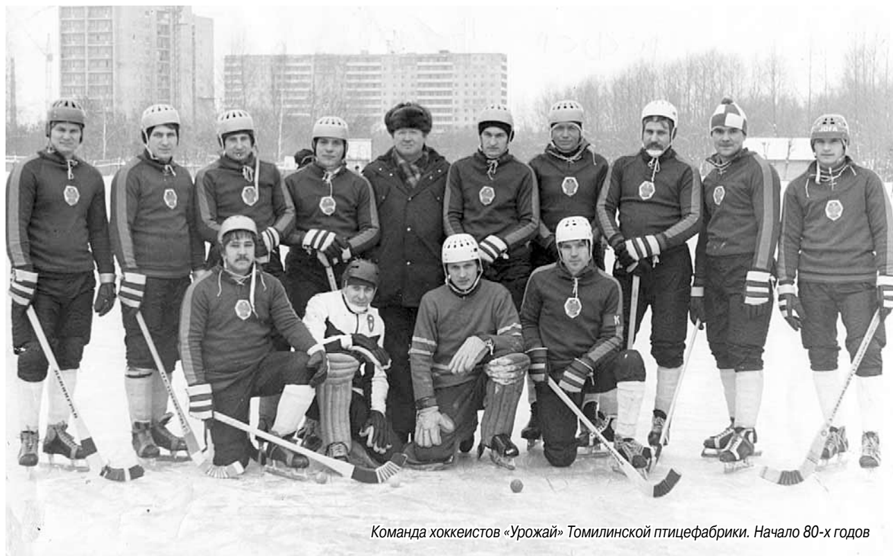
Команда хоккеистов «Урожай» Томилинской птицефабрики. Начало 80-х годов