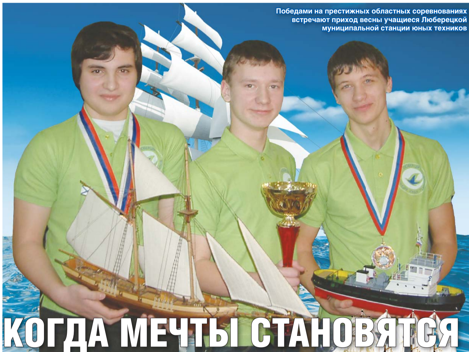
Победами на престижных областных соревнованиях встречают приход весны учащиеся Люберецкой муниципальной станции юных техников