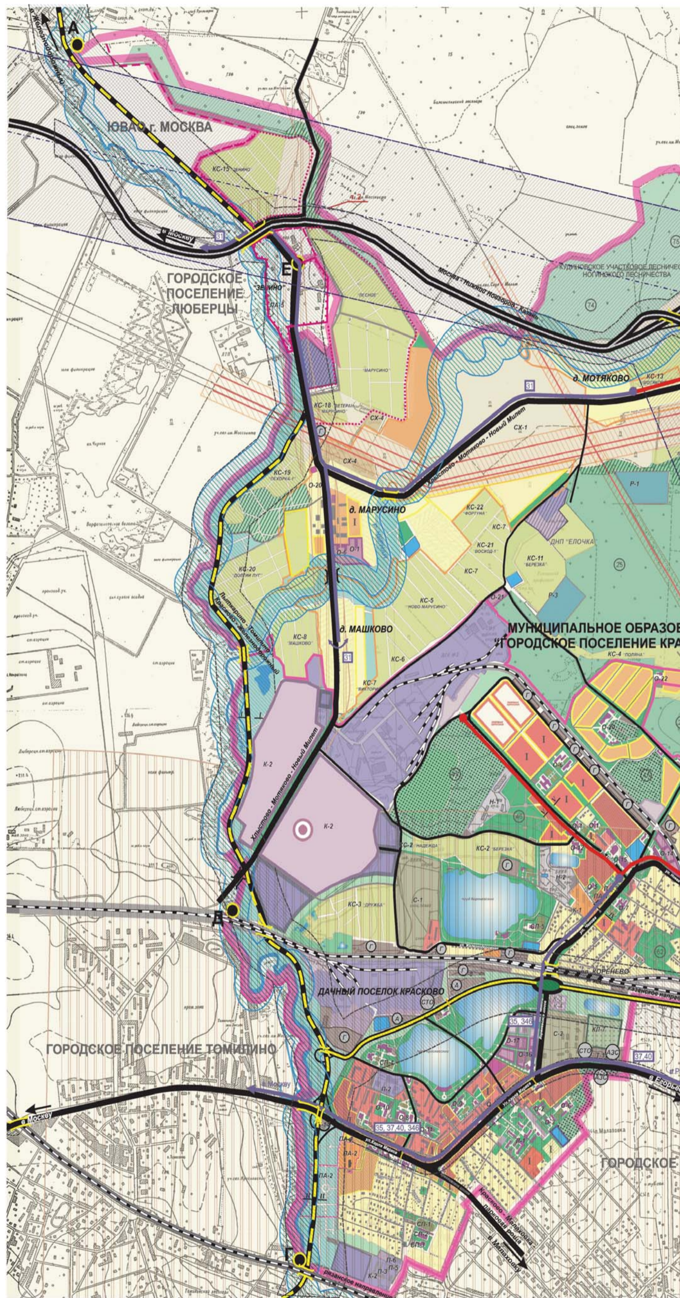
СХЕМА ПЛАНИРУЕМОГО РАЗВИТИЯ ТРАНСПОРТНОЙ ИНФРАСТРУКТУРЫ МЕСТНОГО