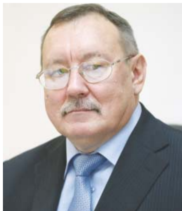
Окончание. Начало на 1-й стр.

Типовые сметы на данные работы прошли государственную экспертизу, что исключает возможности манипулирования ценами. Данные документы опубликованы на нашем официальном сайте в сети интернет www.lubrest.ru в разделе «Раскрытие информации».