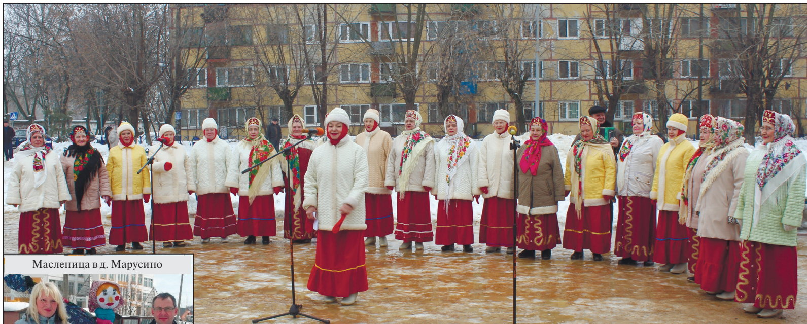
Масленица в д. Марусино