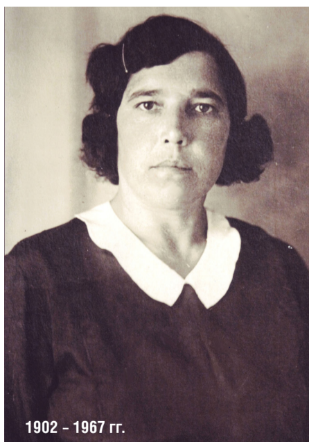
1902 – 1967 гг.

Позднее работала инструктором производственного обучения, готовила для фабрики молодые кадры. Одна из первых вступила в ряды КПСС, вела большую общественную работу. В 1934 г руководство фабрики, партийный и фабричный комитет выдвинули её кандидатуру на долж-