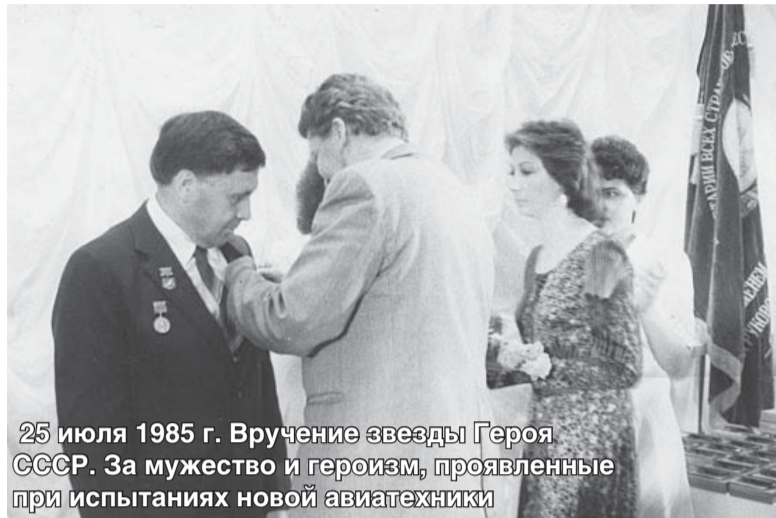
25 июля 1985 г. Вручение звезды Героя СССР. За мужество и героизм, проявленные при испытаниях новой авиатехники